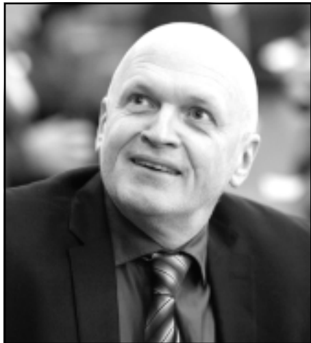
IVARS PUGA, 13.Saeimas deputāts, "KPV LV" frakcija

Esmu starp tiem Saeimas "KPV LV" frakcijas deputātiem, kuri, atsaucoties uz Valsts kontroles revīzijā atklāto par īpašajiem pabalstiem, iesnieguši Saeimā priekšlikumus likumprojektam "Grozījumi Republikas pilsētas domes un novada domes deputātu