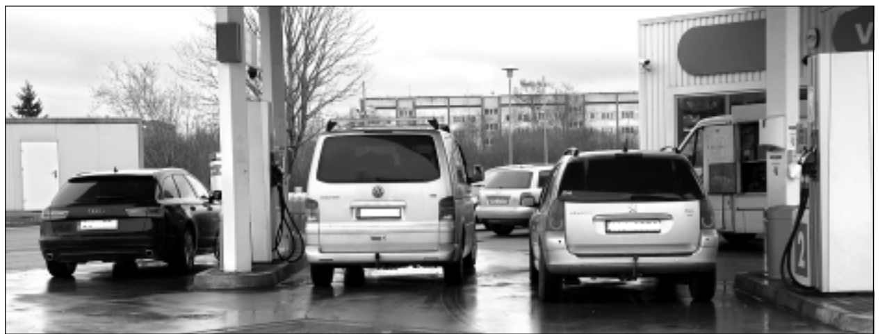
Degvielas uzpildes stacija Balvos.

Degvielas uzpildes stacijā "Gotika auto" minētājā dienā 95.markas benzīns maksāja 1,067 eiro, bet dīzelis – 0,957 eiro. Ar klienta karti par katru litru ir 5 centu atlaide.