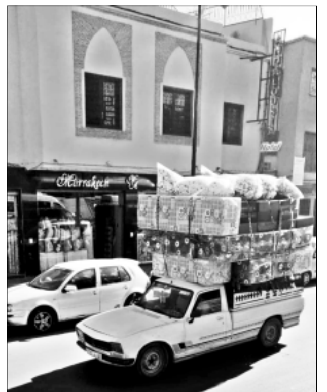
Marakešas pilsēta Marokā. Iesūtīja novadniece no Lielbritānijas.