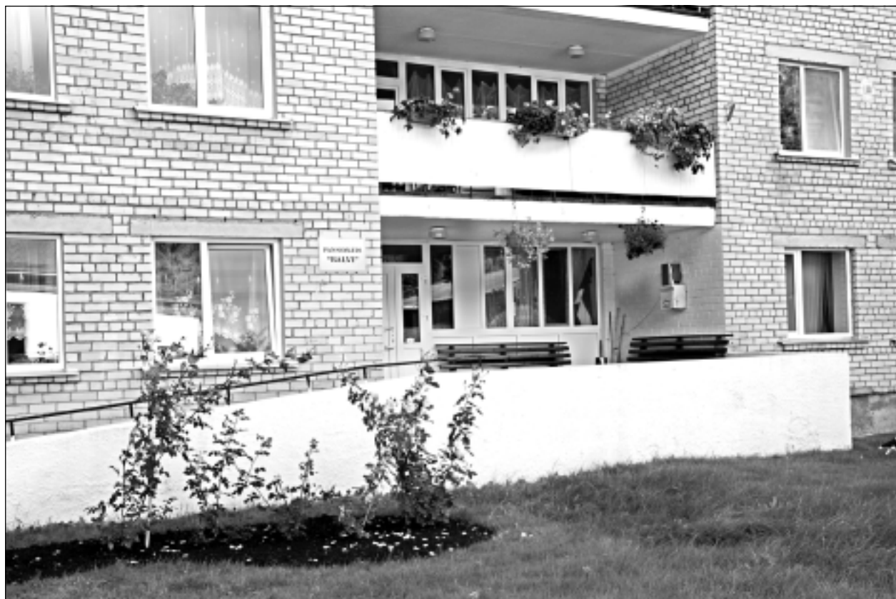
Sociālās aprūpes iestāde Balvu novadā. Pansionāts “Balvi” ir pašvaldības iestāde, kas pieaugušajiem nodrošina ilgstošus sociālās aprūpes pakalpojumus.

-Remontējam istabiņas, ko darām visu laiku. Mūsu lielā zāle gan pagaidām stāv tukša. Bijām noskaņojušies un citīgi gatavojāmies Lieldienu pasākumam, taču tagad tas ir pieklusis, valda pavisam cits noskaņojums. Protams, telpu rotājumi būs, tos mēs visu laiku mainām. Arī iemītniekiem piedāvājam