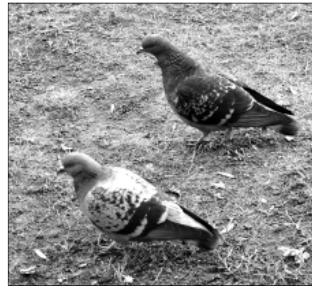
Div' dūjiņas. Iesūtīja Leontīna Dukaļska no Balviem.

Par septembra labākās fotogrāfijas autori atzīta LEONTĪNA DUKAĻSKA ar fotogrāfiju "Latvijas nacionālais putns – baltā cielaviņa", kas publicēta 18.septembrī. Pēc balvas griezties redakcijā.