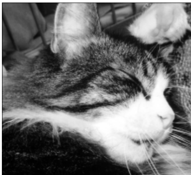
Netraucējiet! Iesūtīja Daniels Kivkucāns no Balviem.

Katra mēneša labākās fotogrāfijas autors saņems balvu. Fotogrāfijas var iesūtīt pa pastu – Balvi, Teātra ielā 8, LV-4501, vai elektroniski – vaduguns@apollo.lv. Pie foto obligāti norādāms vārds, uzvārds (vēlams - tālrunis).