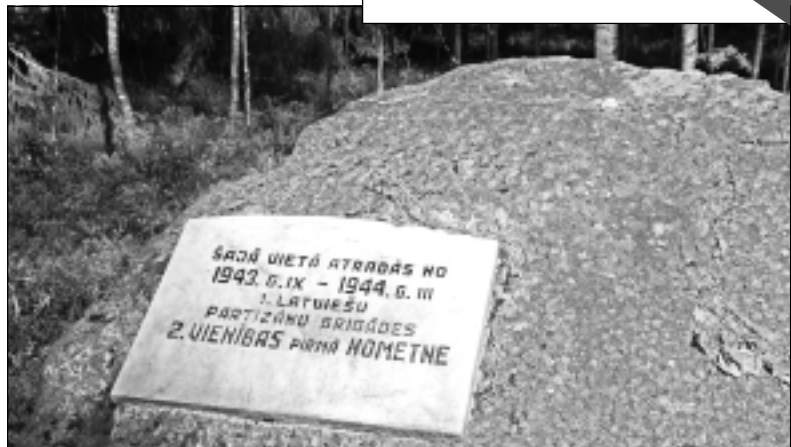
Piemīņas vieta. Stompaku purvā piemiņas akmeņi joprojām apskatāmi divās - gan nacionālo, gan sarkano partizānu (foto) - nometnēs, kas viena no otras atrodas apmēram divu kilometru attālumā.