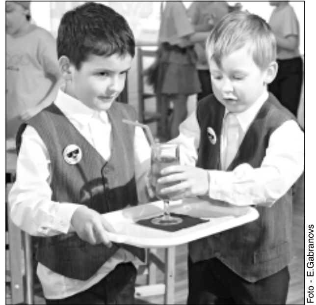
Lūdzu, nogaršojiet! Jaunie prātnieki apliecināja, ka prot ne tikai sagatavot dzērienu, bet arī to eleganti pasniegt.