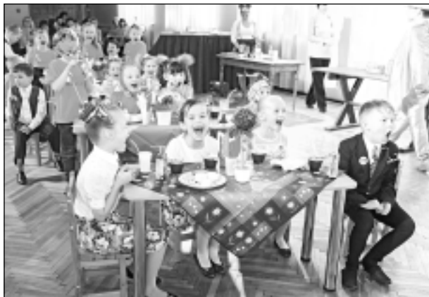
Neslēpj emocijas. Uz jautājumu, vai patik konkurss "Mazais prātnieks", bērnu atbilde bija ne tikai lieliski saklausāma, bet arī acimredzama.

plānoja pasākuma gaitu un nolēma to veltīt Latvijas simtgadei: "Tā kā novadā realizējam veselības veicināšanas projektu, tad arī par šo aspektu neaizmirsām, akcentējot "Vesels bērns Latvijā". Kubulieši cieņpilni pārsteidza ar Rīgas simboliku, uzaicinot bērnus pat uz kafējnicu Vēcrīgā . "Bija garšīgi," vienbalsīgi atzina bērni. Nākamgad, kā svinīgi paziņoja I.Kaļva, "Mazais prātnieks" dosies uz Rugājiem.