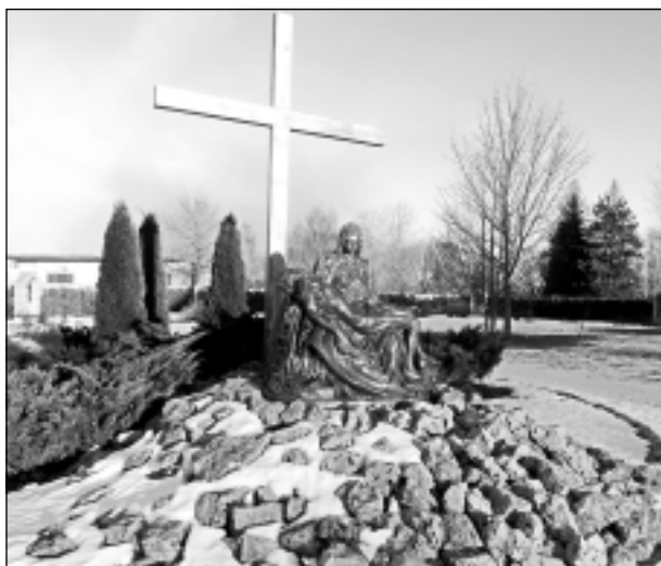
Dziļās sāpes. Iesūtīja Leontīna Dukaļska no Balviem.

Katra mēneša labākās fotogrāfijas autors saņems balvu. Fotogrāfijas var iesūtīt pa pastu – Balvi, Teātra ielā 8, LV-4501, vai elektroniski – vaduguns@apollo.lv. Pie foto obligāti norādāms vārds, uzvārds (vēlams - tālrunis).