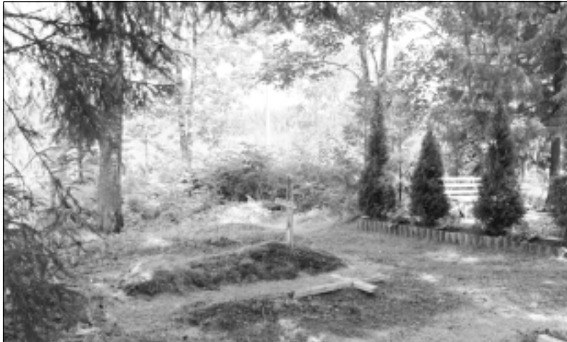
Pamesti kapi. Skaisto Pokratas kapu teritorijā ir gan vietas ar ļoti glīti sakoptām mirušo atdusas vietām, gan daudz sen nekoptu, pamestu kapu.

pavasārī sakopj pēc ziemas, vasarā sakārto pirms kapusvētkiem, bet rudenī nogrābj lapas, sakārtojot ziemai. “Tas ir mazākais, kas jādara normāliem kristīgiem cilvēkiem,” pārliecināts virietis.