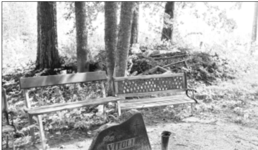
Tā darīt ir nesmuki. Jāatzīst, kapu teritorija ir visai plaša. Acīmredzot tādēļ vairākās vietās cilvēki paši izveidojuši atkritumu izgāztuves. Lai kāds būtu iemesls, nav attaisnojuma gružu izmešanai līdzās citām kapu kopiņām.