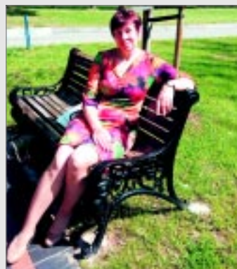
Viena no Ritām.