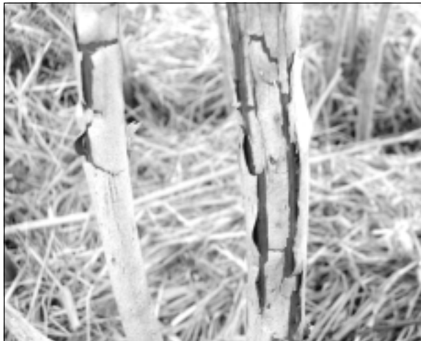
Plaisā aveņu stublāji.

Dārzu saimnieki slimību izplatību novēro arī sīpoliem un gurķiem, ko inficē neistā miltrasa, bet kāpostus, dārza pupiņu, zirņu stādījumos izplatās puves. Burkānu sējumos mitros laika apstākļos palielināsies lapu sausplankumainības izplatība.