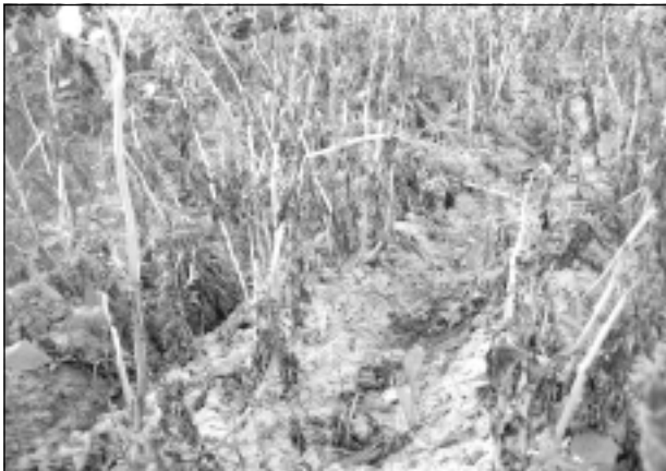
Kartupeļu lakstu puve.