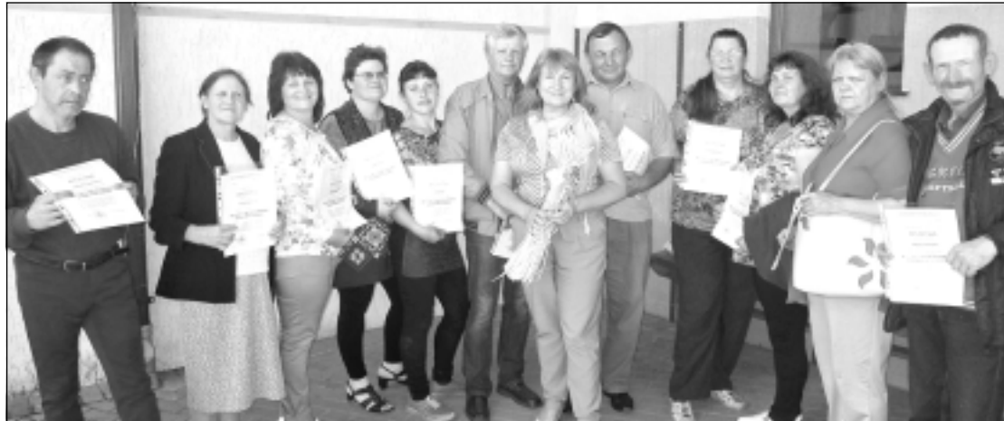
Saņem apliecinājumus. Viļakas darba meklētāji saņēma apliecinājumus, kurās teikts, kādas lekcijas apmeklētās un kādas prasmes iegūtas.