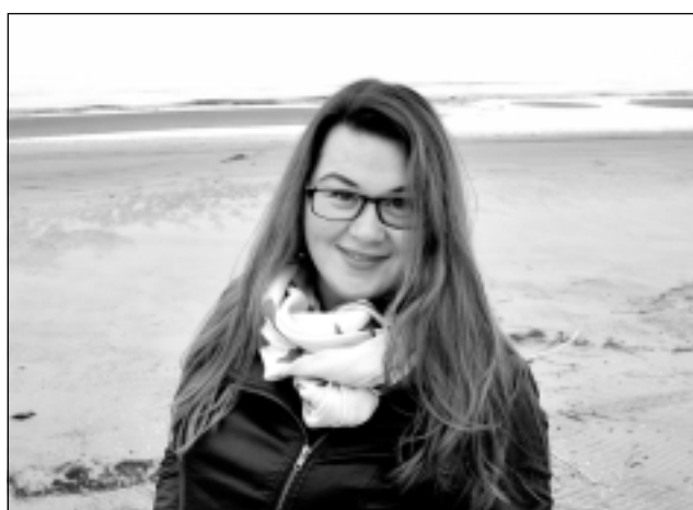
Brīvbūri sagatavoja I. Zinkovska

Ritas dzīvē ir daudz pasākumu, lai gan viņa uzskata, ka šī vasara aizrit mierīgi. Jūnijā viņai bija vairāk aktīvs pasākumu periods gan tepat uz vietas novadā un blakus novados, gan nopietnāks pasākums Jēkabpilī - Dziesmu svētku modelēšanas koncerts. Jūlijā Rita piedalījās arī Latvijas amatierkoru diriģentu nometnē Rīgā, kur ar saviem cunftes brāļiem apsprieda dažādas svarīgas, kā arī sāpīgas tēmas, diriģenti dalījās pieredzē. Vasarā Rita kopā ar brāli uzspēlēja arī pāris ballēs. Kā ceļotājai viņai patīk apbraukt arī vietas tepat Latvijā. Un šovasar izdevies ceļojums uz Bulgāriju, uzkrātas labas emocijas, lai varētu ķerties pie darba valsts 100-gades noskaņā. "Man nekad nav bijis garlaicīgu vasaru!" apliecina Rita.