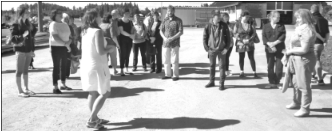
Saimniecībā "Amatnieki-Riekstiņi". Šeit darba meklētāji iepazīna jaunāko tehniku, apskatīja topošās būves un uzzināja, ka jau pavisam drīz drūvās dosies kombaini. Viņi saimniekam vēlēja bagātīgu graudu birumu.