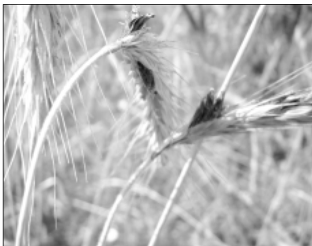
Vārpu plēkšņu pelēkplankumainība.