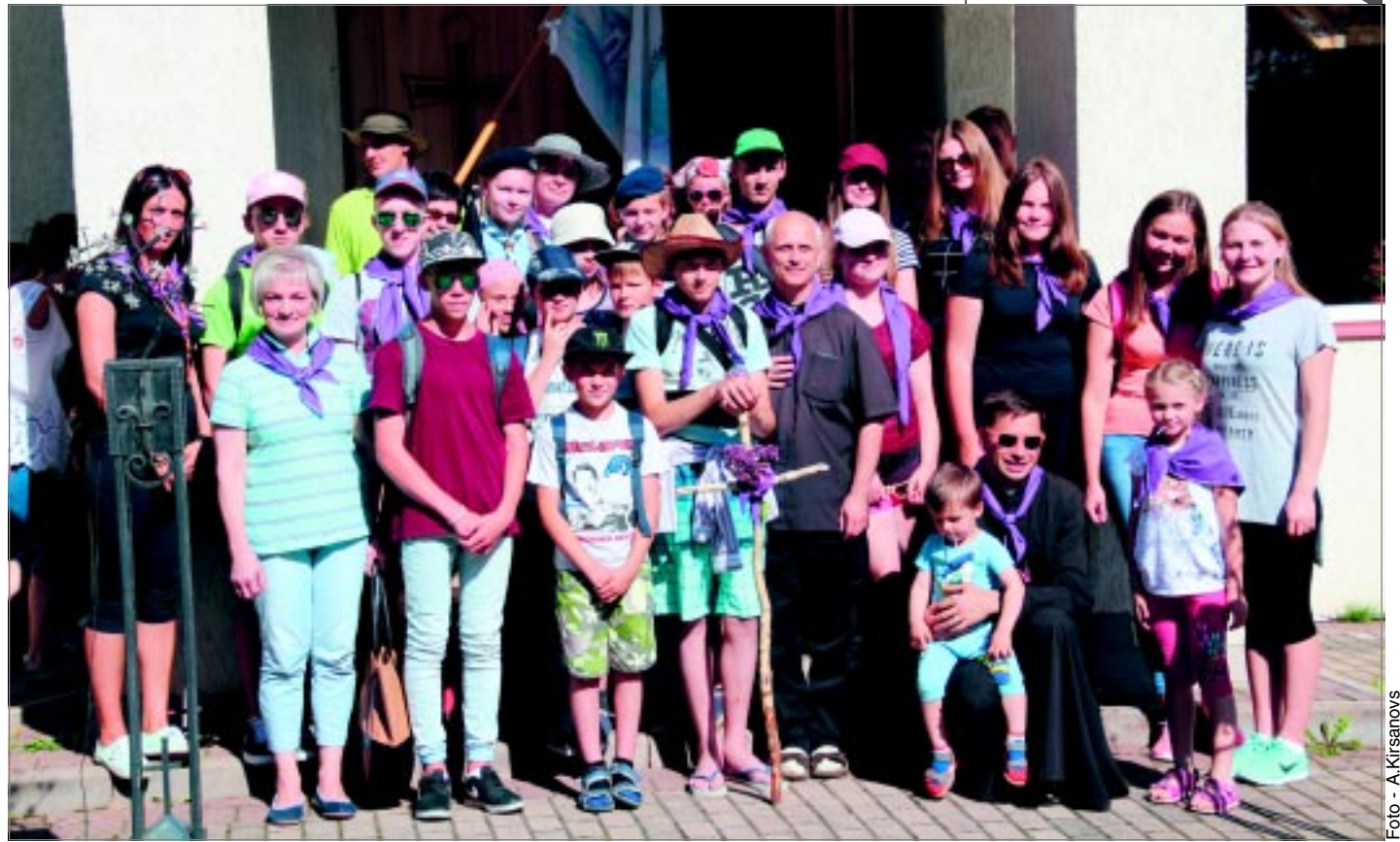
Rekovā. Šonedēļ uz Aglonu devās arī 40 svētceļnieki no Šķilbēnu un Baltinavas katoļu draudzēm.

11. augustā plkst. 11.00 Žiguros ciemosies Dabas aizsardzības pārvaldes speciālisti, kuri vadīs dažādas aktivitātes, kā arī stāstīs un praktiski parādīs, kā jāveic dižkoku uzmērīšana utt.