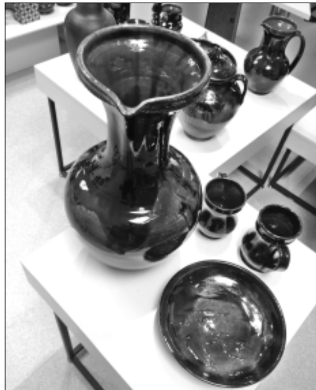
Māla trauku kompozīcija. Dundenieki vienīgi Balvu novadā strādā ar tradicionālo keramiku. Viņi kopj Ziemeļlatgales tradīcijas un nodod savas zināšanas jaunajai paaudzei.

"Katra jauna diena - tas ir laiks, kas mums atvēlēts, lai dzīvotu, mīlētu, realizētu sevi caur lietām, kas mums padodas un sagādā prieku. Mums abiem šāds aicinājums ir keramika, un tā nav nejaušība, ka mūsu kopīgā darba jubilejas izstāde