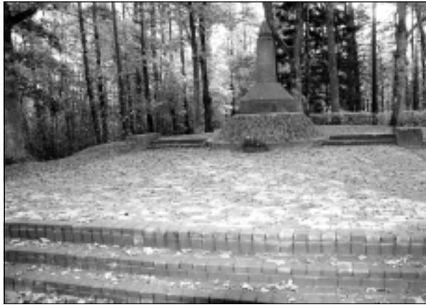
Sakārtoto piemiņas vietas. Viļakas laukos kritušo Latvijas atbrīvotāju piemiņas vietā Jaškavas kapos šovasar uzklāts jauns bruģis.