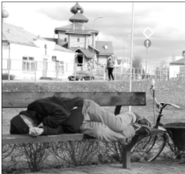
Kritušais nr.4. Netālu no tā dēvēta Staņislava pieminekļa Balvos.