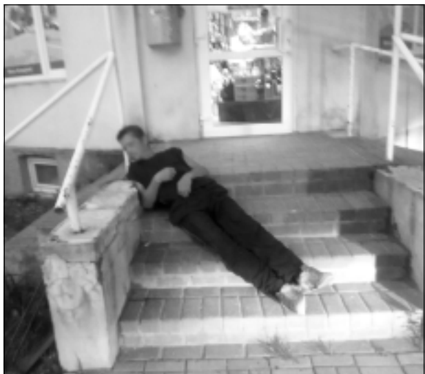
Kritušais nr.1. Ieeja pie kāda veikala Viļakā. Kādēļ gan neapgulties uz trepēm pa diagonāli?