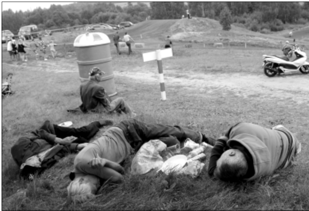
Trīs musketieri. Motokrosa sacensības Viļakā, Susāju pagastā, ārpus sacensību teritorijas.

Jāpiebilst, ka daļa no fotogrāfijām avīzē publicētas jau iepriekš un tās apkopotas ilgākā laika posmā.