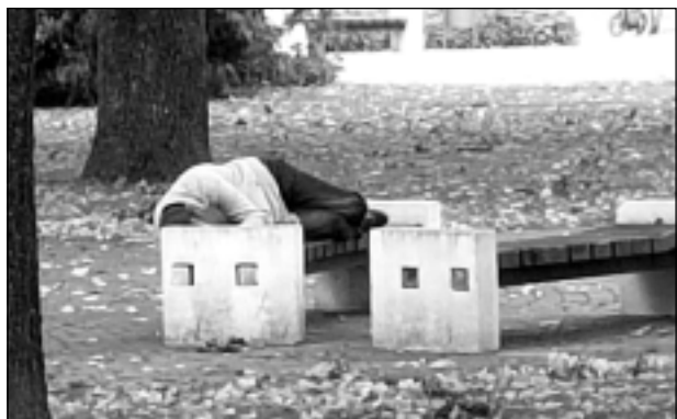
Kritušais nr.2. Balvos, pilsētas skvērā, pēcpusdienas darbīnā.