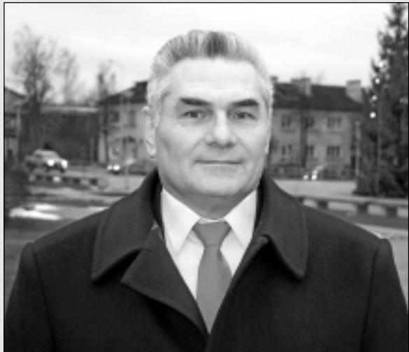
JURIS BOLDĀNS, politiķis