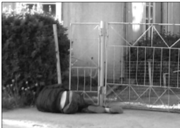
Kritušais nr.3. Pie kādas privātmājas ceļa malā Balvos, Ezera ielā.