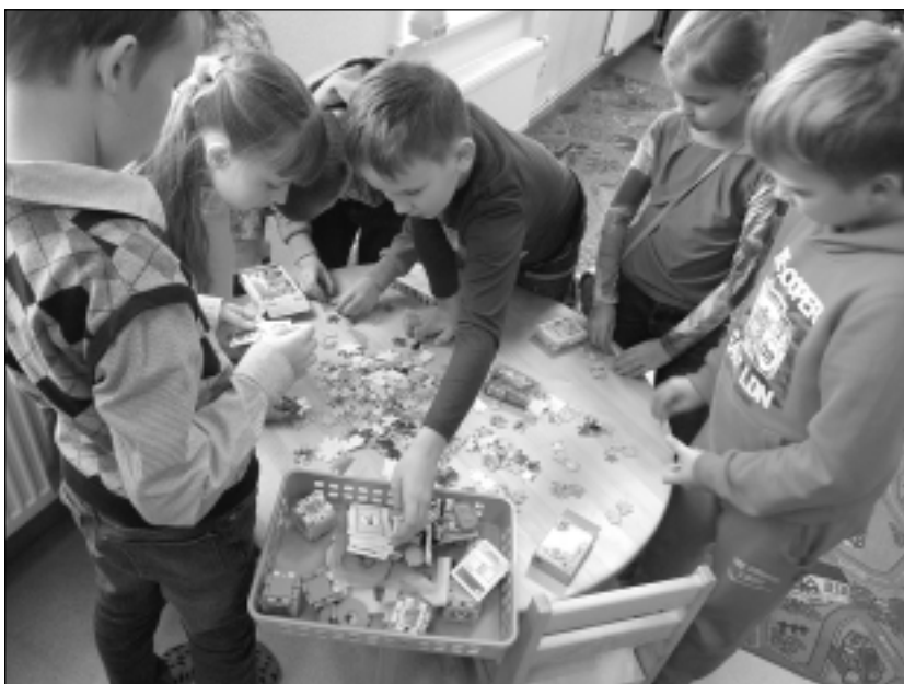
Atdzīvina Balvu Centrālās bibliotēkas bērņu nodaļas telpas. Šeit mazie mākslinieki sakārtoja puzzles un grāmatu plauktus.

Balvu Mākslas skola, nevalstiskā organizācija "Savi" un biedrība "Radošās