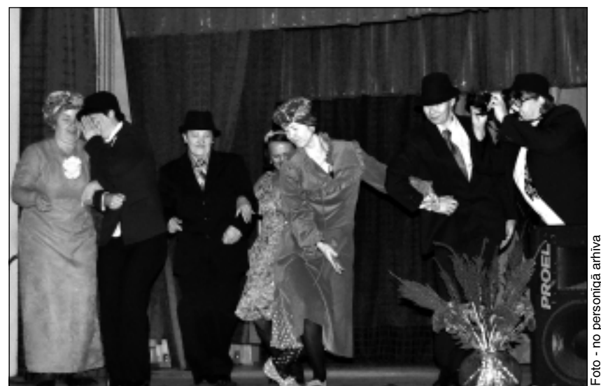
Viļakas linijdeju grupa "Ziemeļmeitas". Viņas izdejoja kinofilmas "Tās dullās Paulīnes dēļ" fragmentus.

Rādījam "Pavāru deju" no kinofilmas "Vella kalpi", likās - mums aplaudēja," stāsta Daiga.