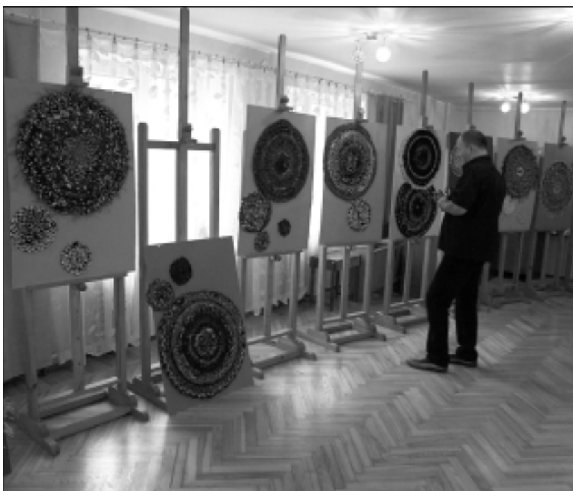
Uzliek izstādi pansionātā. "Krāsu aplī" pansionāta iemītniekiem uzburs jaunības atmiņas un atgādinās par laiku, kad tādus darbus darinājuši paši.