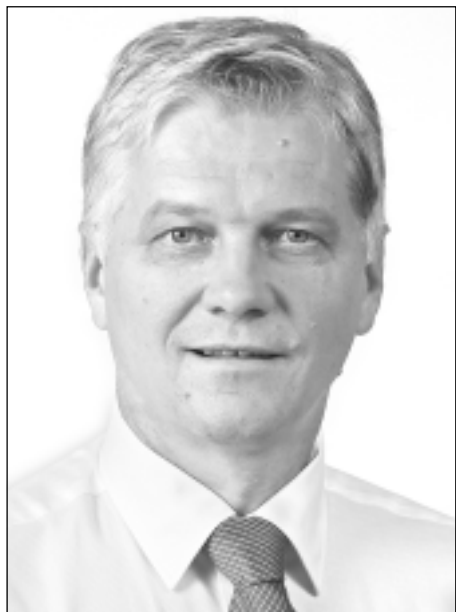
JĀNIS TRUPOVNIĒKS, Saeimas deputāts

Par cēliem mērķiem ierasts runāt, uzsākot ikvienu reformu, optimizāciju, apvienošanu, dalīšanos vai arī kādu citu rīcību. Kopš novadu reformas pagājuši septiņi gadi, un ir īstais laiks veikt rūpīgu analīzi par sasnieg-