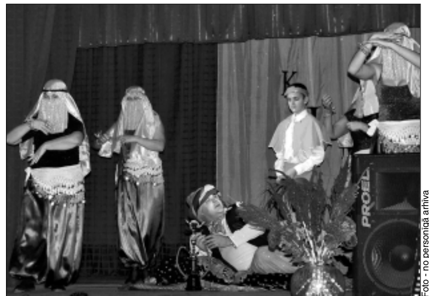
Žiguru ritmikas un linijdeju grupa "Punktiņi". Žigurietes iestudēja un parādīja filmas "1001 nakts pasakas" aktuālākos fragmentus.