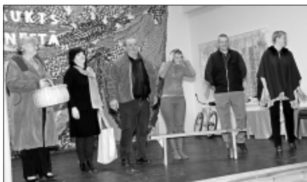
Viļakas kultūras nama dramatiskais kolektīvs. Ar skeču “Baumas” viņiem pārliecinoši izdevās parādīt, kas notiek, ja cilvēkus aprunā nevieta.