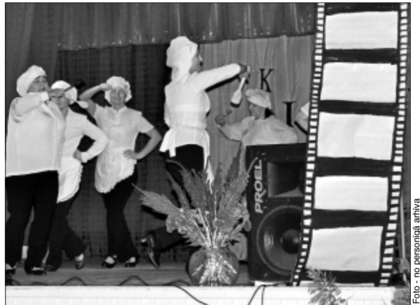
Vectilžas linijdeju grupa. Dejojājas izvēlējās filmas "Vella kalpi" mūsdienīgo versiju.

Gūt jaunu pieredzi - tāds bija Vectilžas dejojātāju mērķis, kur ar sievietēm reizi nedēļā tiek Daiga Lukjanova. "Mēs iesākām darboties ar domu gūt prieku un labāku veselību, bet dejas veidoju pati.