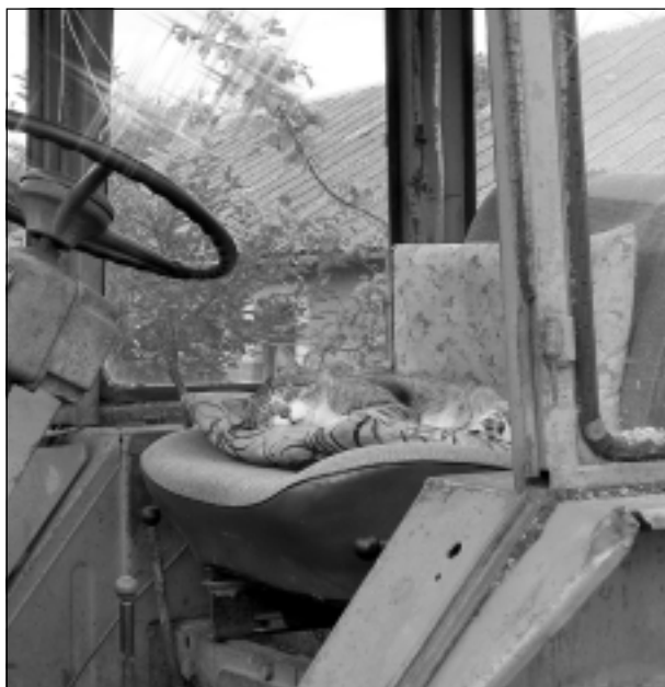
Diendusa. Iesūtīja Jānis Kuprišs.

Katra mēneša labākās fotogrāfijas autors saņems balvu. Fotogrāfijas var iesūtīt pa pastu – Balvi, Teātra ielā 8, LV-4501, vai elektroniski – vaduguns@apollo.lv. Pie foto obligāti norādāms vārds, uzvārds (vēlams - tālrunis).