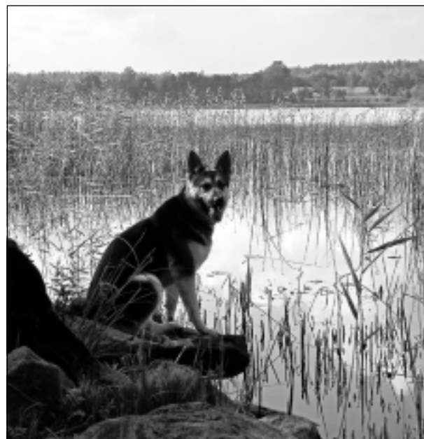
Sardzē. Iesūtīja Jānis Kuprišs.