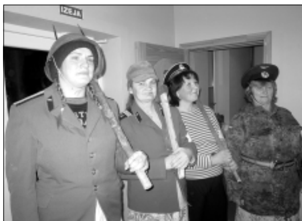
Aizkulisēs. “Bābu bataljona” dalībnieces ar dakšām, cirviem un citiem armijai derīgiem instrumentiem, dzirdot smieklus zālē, aizkulisēs pacietīgi gaidīja uzskatuves.