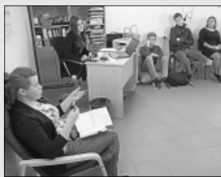
Darbu atsāk Viļakas novada jauniešu dome.

Veterinārārste atgādina, ka katram mājdzīvnieka īpašniekam mājās noteikti jātur perhidrola šķīdums: "Tiklīdz rodas aizdomas, ka dzīvnieks ir apēdis indi, viņam jādod norīt perhidrols. Daudzums atkarīgs no dzīvnieka svara. Vidējam kaķim tā ir aptuveni tējkarote. Tas izraisīs vemšanu, pēc tam steidzami jādodas pie veterinārārsta."