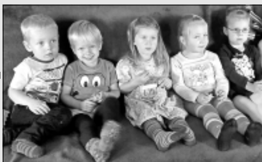
Virtuāla sarakste pārtop draudzībā. 6. lpp.