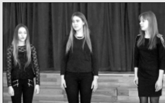
Skolēnu vokālo ansambļu skate "Balsis".