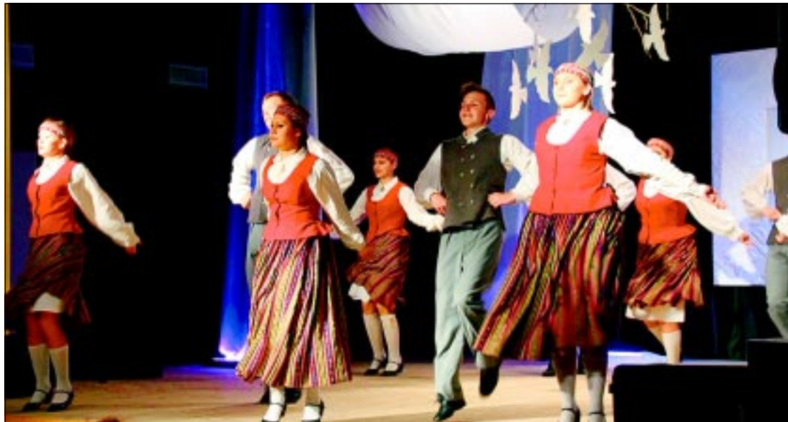
Bez piecām minūtēm absolventi. 12.klases tautu deju kolektīvs skatītājus priecēja ar deju “Mēs ciemiņus gaidījām”.