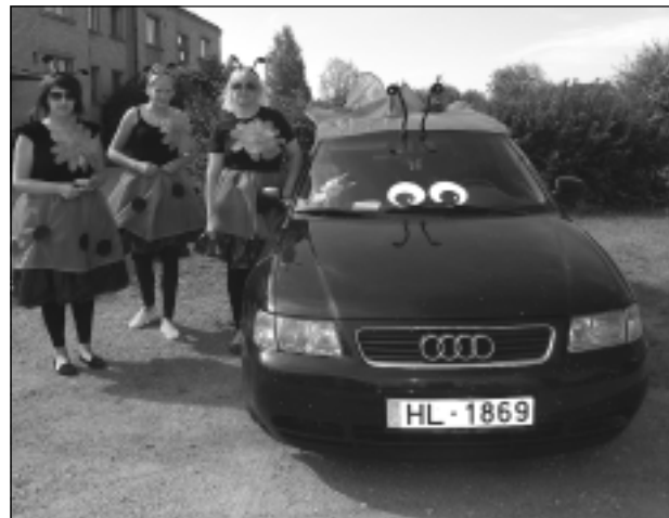
"Bizmārites". Kurš gan nevēlētos satikt šādas dāmas traucamies pa mūspuses lielceļiem?