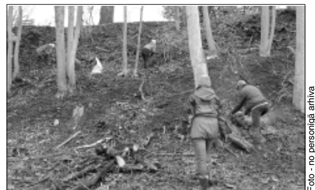
Izcērt kokus. Pavasarī pagasta sabiedrisko darbu veicēji un pagasta pārvaldes palīgstrādnieki izcirta kokus un krūmus kapsētas austrumu pusē, līdz ar to no kalna paveras lielisks skats uz apkārtni līdz pat šosejai.

pagasts," saka B.Bogdane. Tagad kapu pārziņiem par šo pienākumu pildīšanu maksā procentus no minimālās algas. Arī Golvaru, Līdumnieku un Saksmāles kapu vecākajiem, Bēržu kapu vecākajam - 0,13% no minimālās algas katru mēnesi.