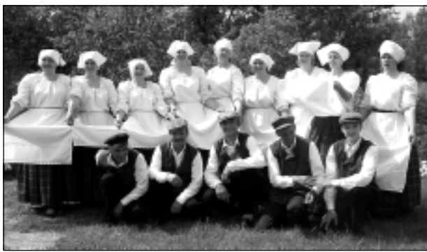
Uzgriezisim deju? Par lustīgiem mirkliem pagasta svētkos parūpējās deju kolektīvi, tostarp Krišjāņu vidējās paaudzes deju grupa.