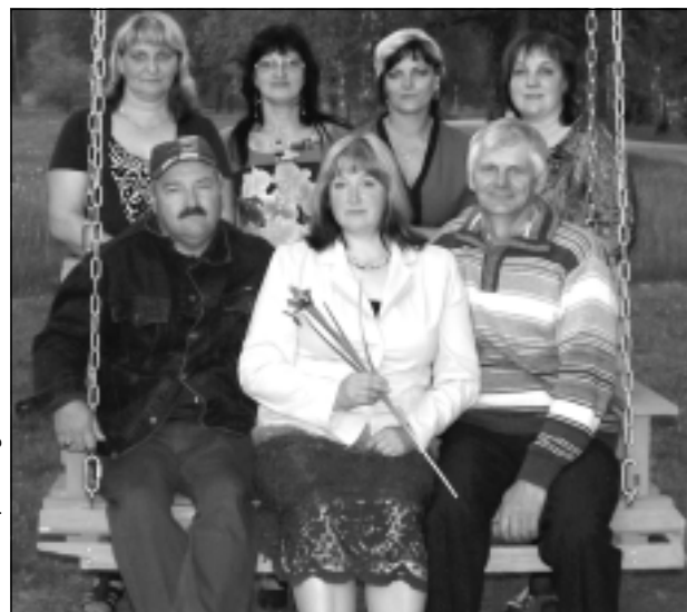
Ciemiņi no Gaigalavas. Tālo ceļu uz Krišjāņiem mēroja arī pašdarbnieki no Rēzeknes novada Gaigalavas.