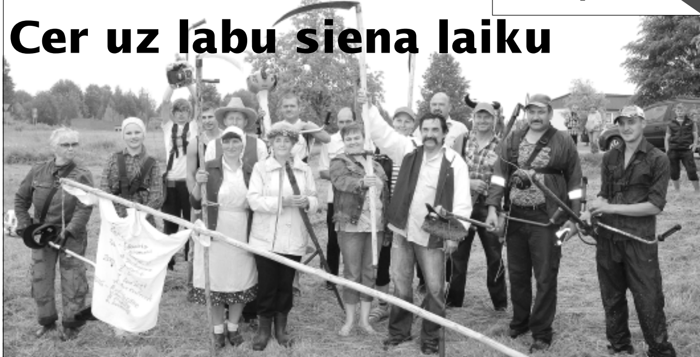
Ligo dienas priekšvakarā. Briežuciemieši nešaubās, ka iemācīties pļaut ar izkapti var ikviens, turklāt pareizi izkulta izkaptis, kā sprieda viņi, pati griež.