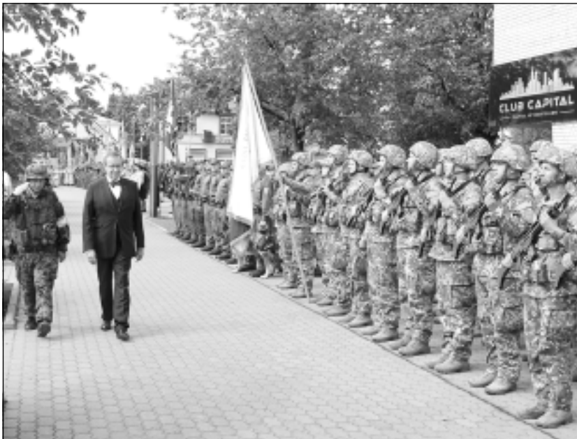
Zemessargus sveic Igaunijas prezidents. Igaunijas prezidents Tomass Hendriks Ilvess kopā ar Igaunijas parādes komandieri soļo garām 31.AMII bataljona parādes vienībai, kurā lielākoties bija mūspuses novadu zemessargi no 1.Kājnieku rotas.