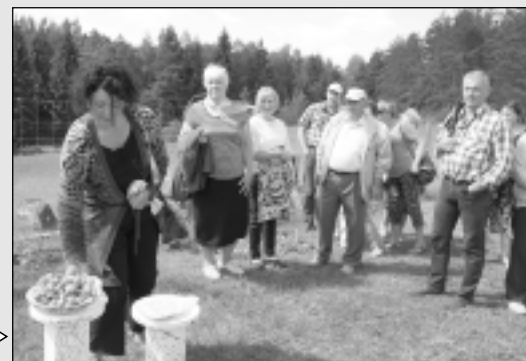
Latgales agronomi satiekas Balvos.