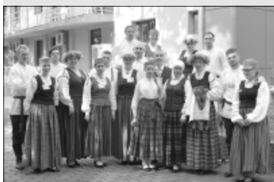
Folkloras kopa "Upīte" dzied un dejo Rumānijā.