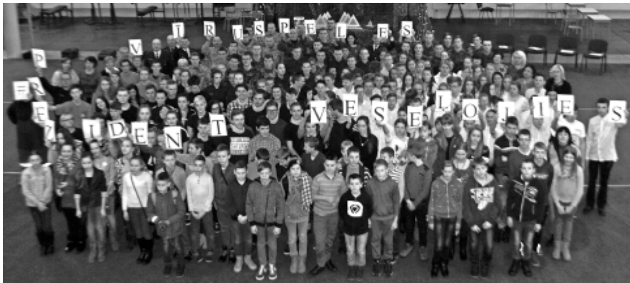
Prezidenta atbalstam. Pirms spēļu sākuma visi to dalībnieki, vērtētāji un ciemiņi pulcējās kopā zibakcijai, kuras laikā, izveidojot uzrakstu "Prezident, veselīgies!", novēlēja Valsts prezidentam Raimondam Vējonim drīzu atlabšanu.