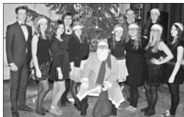
Ziemassvētki sabraukuši! Skolas Ziemassvētku pasākuma vadītāji - 10.klase - kopā ar burvīgo Ziemassvētku vecīti.