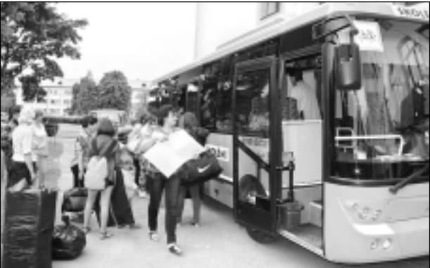
Ceļā uz Dziesmusvētkiem. Vidusskolas jauktais koris gatavs braucienam uz Rīgu. Piedalīšanās XI Latvijas skolu jaunatnes dziesmu un deju svētkos - liels gods, atbildība, slodze un gandarījums.