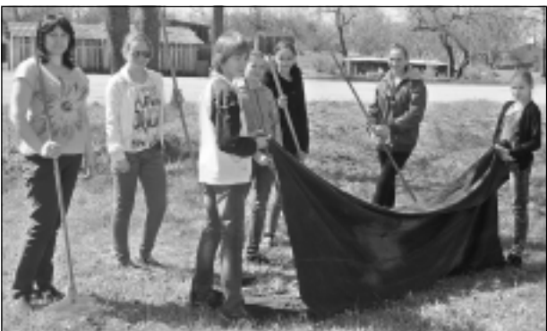
Pavasara talka. Darbs skolas teritorijā - patīkama pārmaiņa pēc sēdēšanas skolas solā.