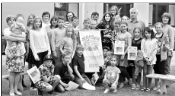
"Vosoras raibumi Baļtinovā". Skolēnu radošās nometnes noslēguma foto ar nometnes karogu centrā.