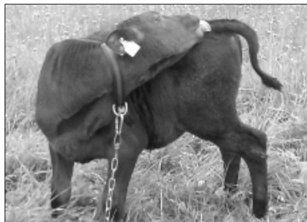
Piedzīvojumi vasarā. Iesūtīja Natālija Zēģele no Baltinavas.