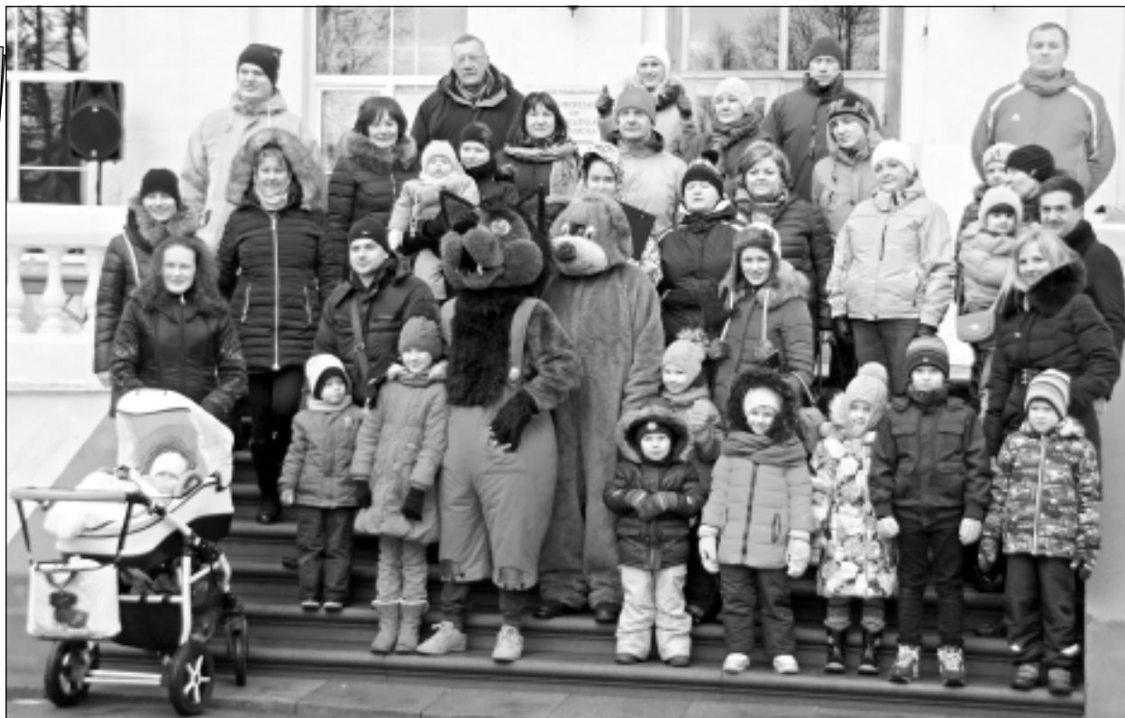
Foto piemiņai. Klātesošajiem bija iespēja piedalīties sešās stafetēs, piemēram, plastmasas futbolā, Rūdolfa skrējienā, dubļu biatlonā un citās aktivitātēs.

Savukārt noskatoties Balvu Profesionālās un vispārīgglītojošās vidusskolas tradicionālās "Vīru spēles", pārliecinājos, ka meitenes sportiskuma, veiklības, attapības un uzņēmības ziņā nemaz neatpaliek no zēniem. Turklāt ierindas skatē gandrīz visu klašu komandieru lomās iejutās tieši daiļā dzimuma pārstāves. Vienā ziņā tas pierādē, jo dzīvē šīs meitenes spēš pastāvēt par sevi, no otras – nedaudz apbēdina, jo liecina par zēnu mazo aktivitāti un nevēlēšanos uzņemties atbildību. Protams, ne jau visi ir vienādi, jo netrūkst arī stipru, gudru un uzņēmīgu puišu. Tomēr gribas teikt – puikas, saņemieties! Ļaujiet taču meitenēm būt vājam dzimumam!