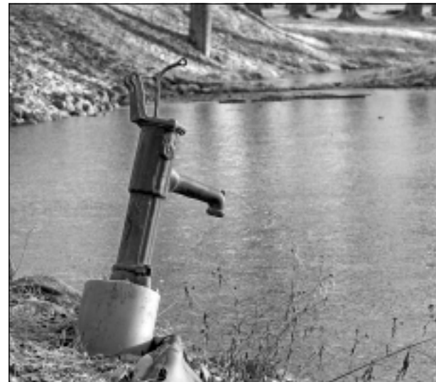
Ari tā mēdz izskatīties. Iesūtīja Juris Kašs no Balviem. Lappusi sagatavoja E.Gabranovs