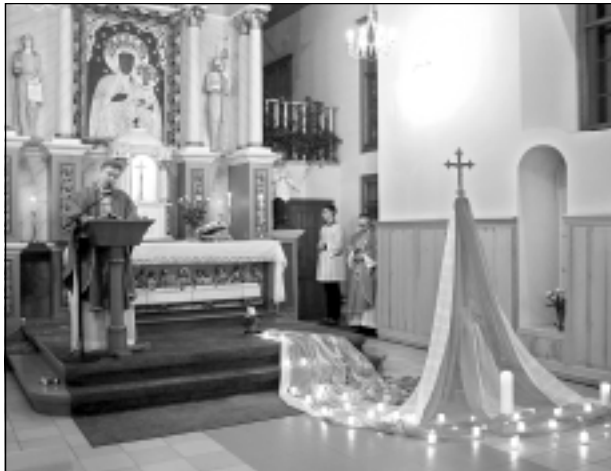
Svētā Mise. Sv. Misi celebrē Balvu un Gulbenes prāvesti.