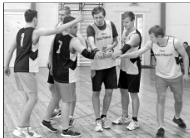
Sports pie mums ir cienā! Īpaši sīvu konkurenci saviem pretiniekiem rada Baltinavas volejbolisti.