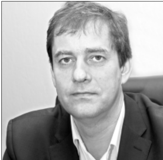
DIDZIS ZEMMERS , Limbažu novada domes priekšsēdētājs