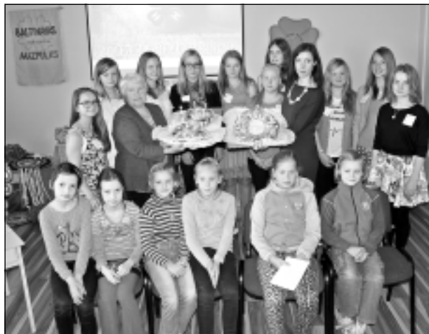
Jubilejas torte. Baltinavas vidusskolas mazpulkam - 20.