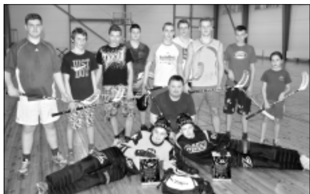
Gatavi cīnīties. Jaunsargi izmēģina jauno florbola ekipējumu.