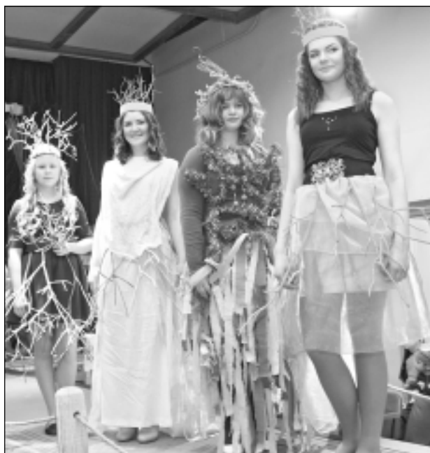
Tērpu kolekcija "Koraļļi". Arī šogad Baltinavas vidusskola piedalījās kaimiņu - Kristīgās internātpamatskolas - organizētajā modes skatē.