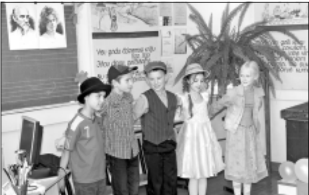
Dzejas dienas. Lieli un mazi atzīmēja latviešu dižgaru Raiņa un Aspazijas 150-gadi.