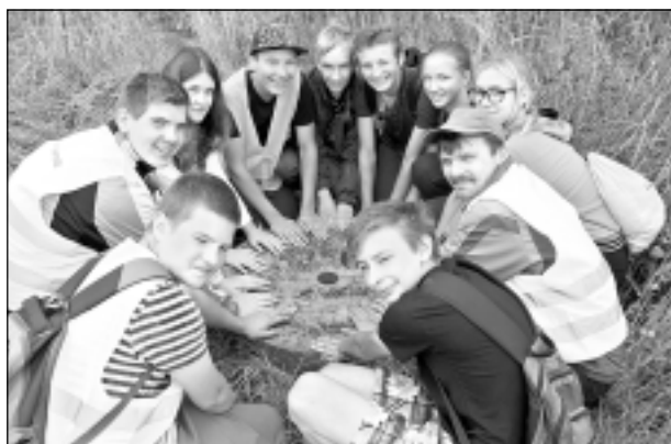
Rudens velobrauciens - 2015. 8.klase pie dzirnākmens - 57.ziemeļu paralēles zīmes.