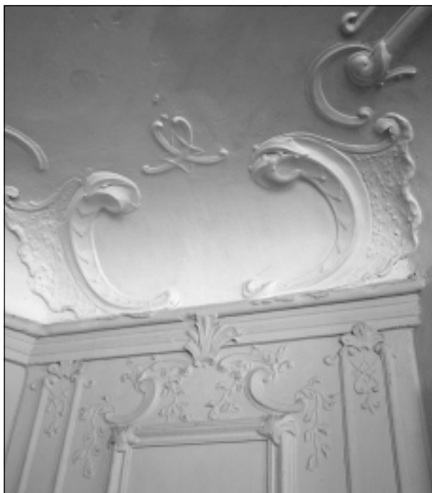
Seni raksti. Krišjāņa Valdemāra pamatskola atrodas kādreizējā Beļavas muižā un darbojas te jau kopš 1925. gada. Tā ir vienīgā skola pagastā, kur kopā ar pirmsskolas bērnu grupām pašlaik mācās 78 audzēkņi. Skolas pirmais stāvs ir gandrīz tāds pats kā muižas laikā: durvis, podiņu krāsnis, marmora flīzes, iebūvētie skapji, koka paneļi.