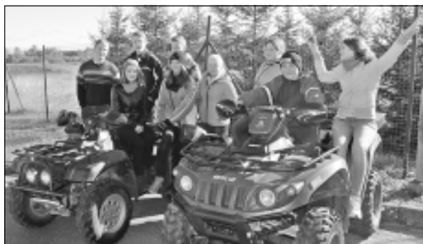
Iepazīstam Valsts Robežsardzes ikdienu. 9.klase izmēģina robežsargu kvadriciklus.

Miļi gaidīti sestdien, 13.februārī plkst. 18.00 Baltinavas kultūras namā un turpinājumā skolas telpās! "Vasali Baļtinovā! Laipni lyugti dzymtajā skolā!" - tas ir aicinājums Jums katram!