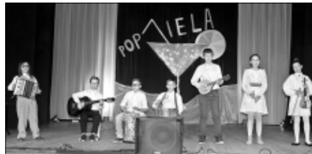
"Popiela" Baltinavā. Uz skatuves baltinavieši iejutās arī Latgales mūziķu - Uškānu ģimenes un "Laimas muzikantu" - lomās.