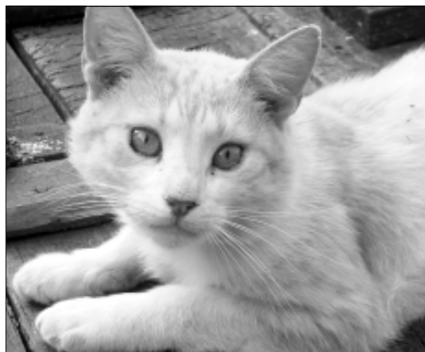
Ko vēlaties? Iesūtīja Elmārs Zelčs.

Katra mēneša labākās fotogrāfijas autors saņems balvu. Fotogrāfijas var iesūtīt pa pastu - Balvi, Teātra ielā 8, LV-4501, vai elektroniski - vaduguns@apollo.lv. Pie foto obligāti norādāms vārds, uzvārds (vēlams - tālrunis).