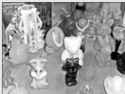
Skatāma sveču izstāde.