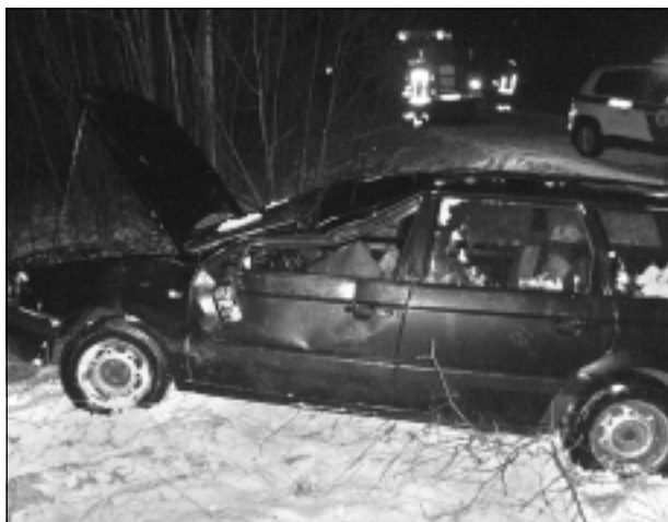
Notikuma vieta. Šāds skats pavērās notikuma vietā Šķilbēnu pagastā neilgi pēc avārijas.

Kopumā laikā, kad mūspusē notika traģiskais ceļu satiksmes negadījums, Latvijā reģistrēti 50 ceļu satiksmes negadījumi, kuros viens cilvēks gāja bojā, bet vēl septiņi guva traumas.