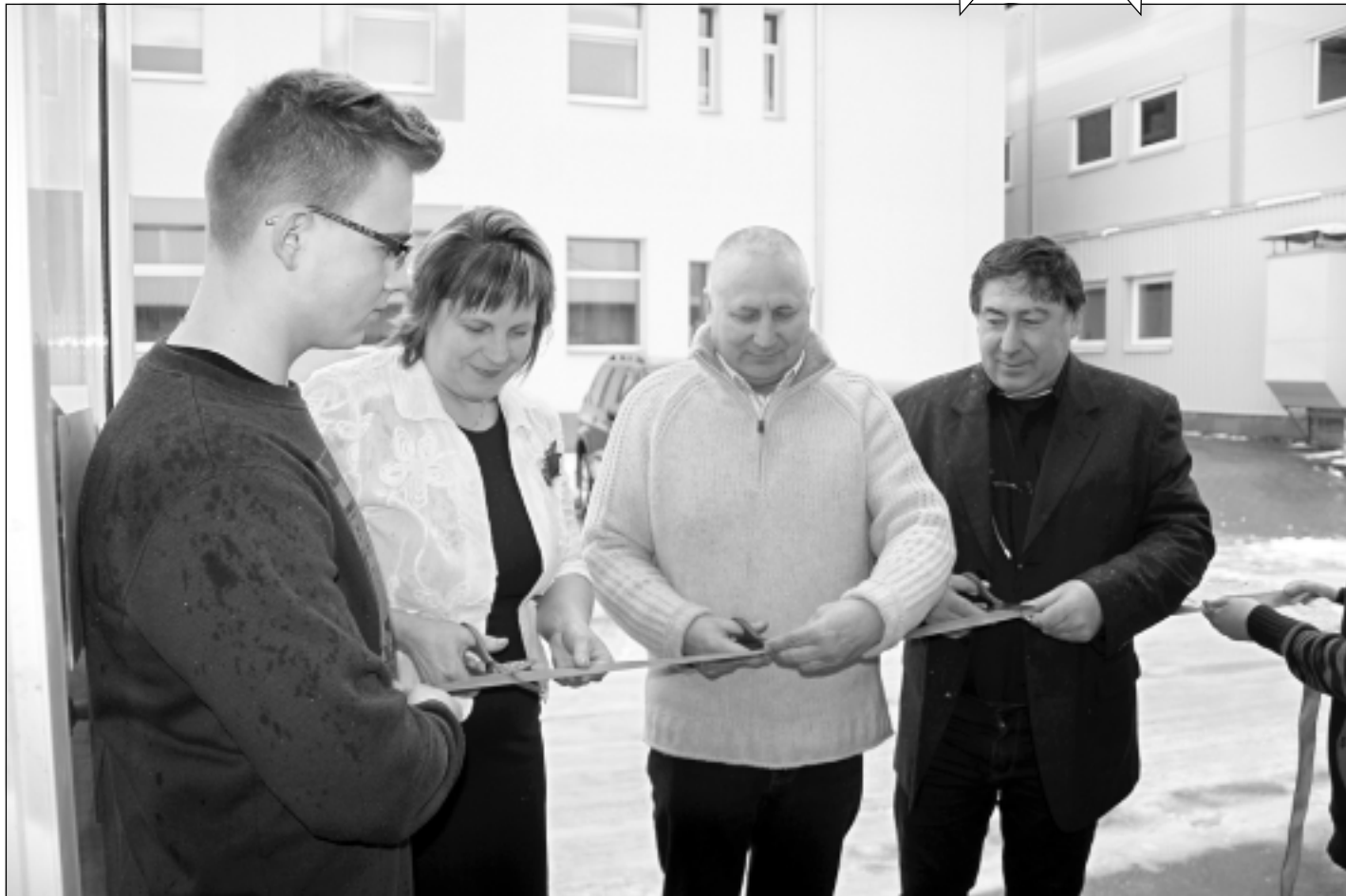
Pārgriež lentu. 8.decembris Rugāju novada vēsturē ieies ar faktu, ka blakus novada vidusskolai atklāja jauniešu iniciatīvu un interešu centru, kā arī ēdināšanas bloku.

15.decembrī plkst. 10.00 Balvu novada pašvaldības ēkā notiks kārtējā domes sēde. Atgādinām, ka tās ir atklātas, kurās var piedalīties ikviens interesents.