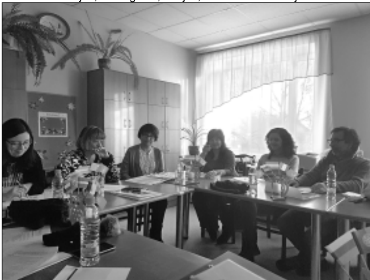
Darba moments. Viena no svarīgākajām semināra tēmām bija starpvalstu vizītes, komunikācijas un sadarbības attīstības iespējas.