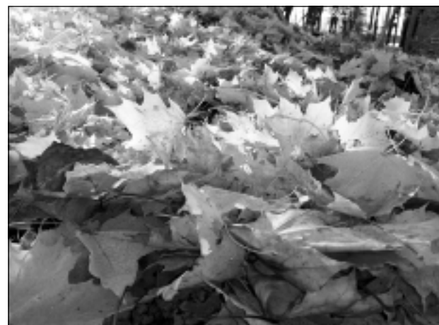
Lapu paklājs. Iesūtīja Salvis Dundenieks no Bērziņu pagasta.