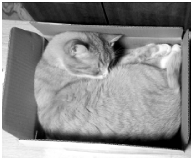
Paciņa gatava.

Katra mēneša labākās fotogrāfijas autors saņems balvu. Fotogrāfijas var iesūtīt pa pastu – Balvi, Teātra ielā 8, LV-4501, vai elektroniski – vaduguns@apollo.lv. Pie foto obligāti norādāms vārds, uzvārds (vēlams - tālrunis).