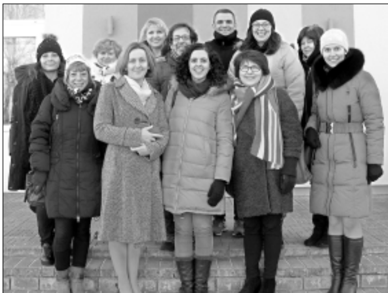
Visi kopā. Skolotāji – koordinatori no visām piecām projektā iesaistītajām valstīm – Turcijas, Portugāles, Itālijas, Lietuvas un Latvijas.

Viesiem tika piedāvāta iespēja iepazīties ar Latvijas tradīcijām un kultūru, apmeklējot Balvu Novada muzeju, Susāju pagasta kultūrvēstures muzeju "Vēršukalns", kur nobaudīja pašceptu maizi un frikadeļu zupu. Valstu koordinatori ļoti patika skolas deju kolektīvu, solistu un ansambļa priekšnesumi. Semināra noslēgumā visi valstu dalībnieki apmeklēja Balvu peldbaseinu. Kaut arī laika apstākļi nelutināja, seminārs izdevās, viesi mājās atgriezās pozitīvām emocijām un idejām bagāti.