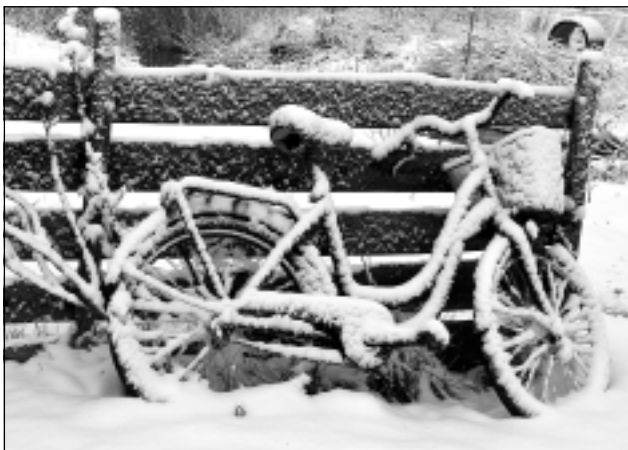
Rīta pārsteigums. Tāds skats pie mājas rīta agrumā pārsteidza Velgu Vīcupu.