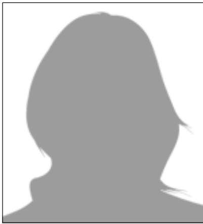
VECMĀMIŅA no laukiem

Internetā izlasīju uzaicinājumu, kas mīļi un glaimojoši uzrunā Balvu puses vecmāmiņas piedalīties skaistumkonkursā, precīzāk – konkursā vecmāmiņām, solot daudz un dažādas izklaides, pat jaunus draugus. Gatavošanās notikšot aprīlī un maijā. Ko nu? Dzīvoju laukos, un lauku vecmāmiņām aprīlis un maijs ir īstākais laiks sēt un stādīt gan skaistumam, gan ģimenes galdam saviem mīļajiem. Un vēl nesaprotu, pēc kādiem kritērijiem