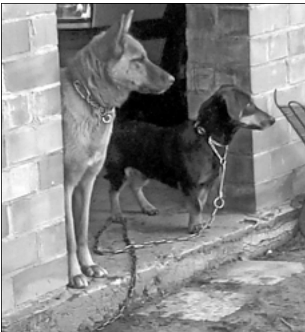
Kas tur nāk? Pastnieks nāk... Iesūtīja Iveta Medniece no Veckupravas.