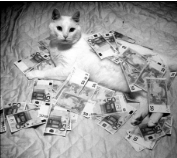
Laiks pāriet uz ofšoru. Iesūtīja Gunita Dobrovojska no Rugājiem.

Katra mēneša labākās fotogrāfijas autors saņems balvu. Fotogrāfijas var iesūtīt pa pastu - Balvi, Teātra ielā 8, LV-4501, vai elektroniski - vaduguns@apollo.lv. Pie foto obligāti norādāms vārds, uzvārds (vēlams - tālrunis).