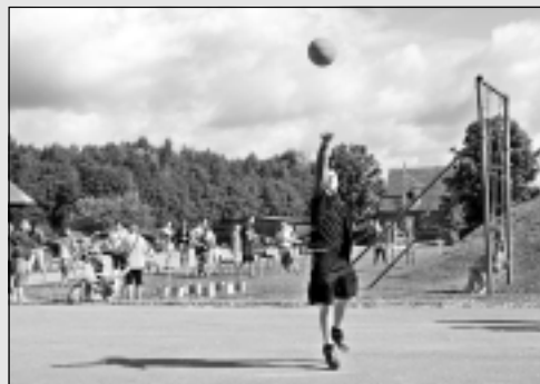
Vectilzā sacensības atklāj ar parādi.