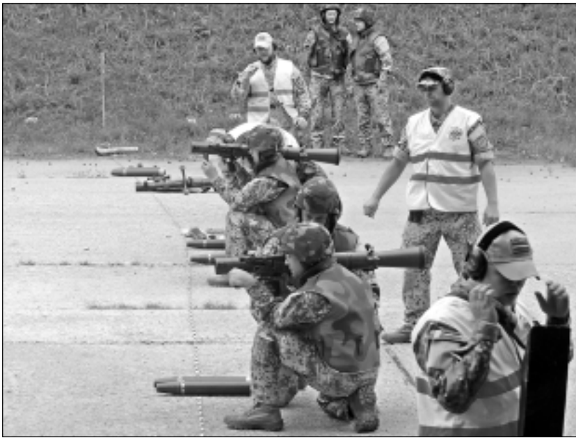
Appūst jaunas iemaņas. 30. augustā mūsu puses zemessargi piedalījās prettanku ieroču "Carl Gustav" kaujas šaušanas apmācībā.

notika ar mūsu vectēvu, kuram boļševiki izdūra acis un sapūdēja grāvi, jo viņš negribēja iet krievu armijā."