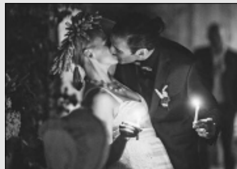
Trīs kāzas divos mēnešos.