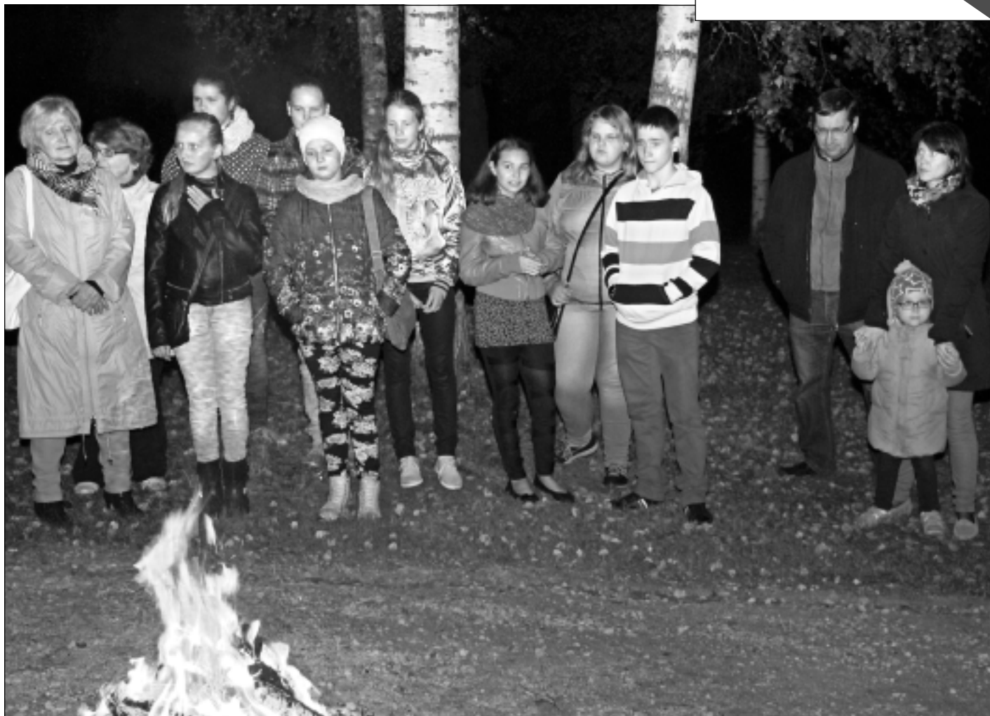
Satiekas pie ugunsкура. Sanākšanas brīžos svarīga kopības sajūta, vienotība dziesmā, arī mirkli, kad cilvēki dalās pārdomās un atmiņu stāstos. Lai arī senie vēstures notikumi aiziet pagātnē, tie ir jāglabā tautas atmiņā. Viļakas Valsts ģimnāzijas 7.klase un audzinātāja pie ugunsкура uzsāka dziesmu "Pi Dīveņa gari goldi...", jo arī šī ir visus vienojoša dziesma.

Konkursa "Drošākais uzņēmuma autoparks" mērķis ir noskaidrot Latvijā labākos uzņēmumu autoparku pārvaldītājus, kā arī uzlabot kopējo satiksmes drošību Latvijā. Pieteikties konkursam aicina visus uzņēmumus, kuru autoparkā ir desmit vai vairāk transportlīdzekļu. Uzņēmumi dalību konkursam var pieteikt līdz 22.oktobrim, elektroniski aizpildot īsu un vienkāršu anketu saitē balta.lv/autoparkiem .