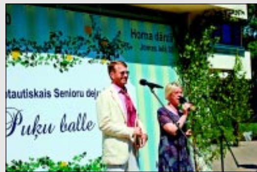
Pilnie svaru kausi - līdzsvarā.