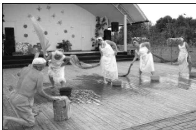
Dvieļi lido pa gaisu. Rubeņu amatiereteātra sievas slapjos dvieļus velēja, tā teikt, mūsdienu gaumē ar tādu intensitāti, ka pat pieredzējušiem malkas cirtējiem, šķiet, būtu iemesls pakasīt galvas.