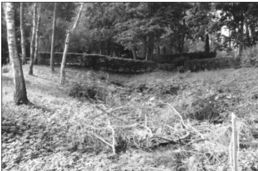
Improvizēta atkritumu bedre. Gravu pie Bēržu kapiem aizgājēju tuvinieki jau izsenis iecienījuši kā piemērotu vietu atkritumu izmešanai. Arī pēc tam, kad tā iztīrīta, nepaieļ ilgš laiks, līdz atkal paveras iepriekšējā aina.