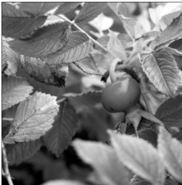
Rudens. Iesūtīja Juris Kašs no Balviem.

Katra mēneša labākās fotogrāfijas autors saņems balvu. Fotogrāfijas var iesūtīt pa pastu - Balvi, Teātra ielā 8, LV-4501, vai elektroniski - vaduguns@apollo.lv. Pie foto obligāti norādāms vārds, uzvārds (vēlams - tālrunis).