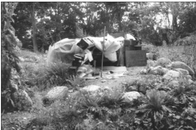
Kapličas vietā drupas. Bēržu kapličas vietā šobrīd redzama drupu kaudze, taču pašvaldība nav metusi plinti krūmos. Drīzumā beigsies tehniskās dokumentācijas izstrāde un atkal sāksies finansējuma meklēšana kapličas restaurācijai.

Pagasta pārvaldniece uzskata, ka atkritumu konteineru uzstādīšana kapos varētu radīt citu problēmu – neapzinīgi iedzīvotāji varētu šos konteinerus aizpildīt ar atkritumiem, ko atveduši no mājām. "Taču, iespējams, Bēržu kapos tomēr konteineru uzstādīsim," varbūtību izteica pagasta pārvaldniece.