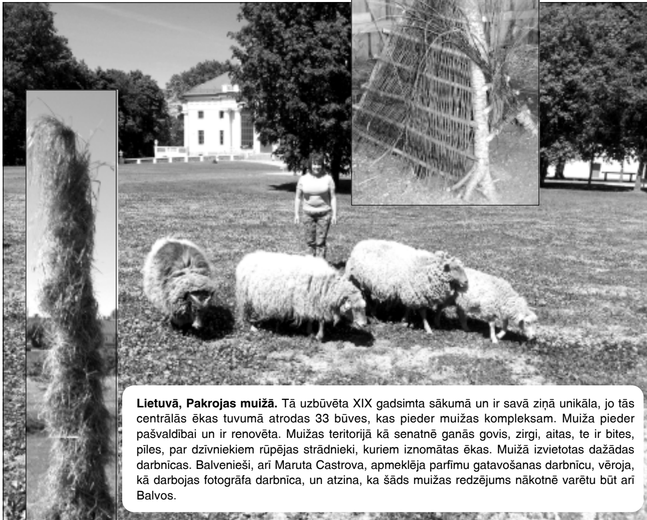
No vietējos krūmos grieztiem zariem var izgatavot neparastu un stilīgu būrīti paipalām.