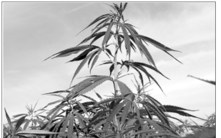
Lappusi sagatavoja M.Sprudzāne

Latvieši prata gatavot plāksterus pret augoņiem un vātīm. Plāksteris sastāvēja no kausēta vaska un kaņepju eļļas maisījuma, kas uzklāts uz tīra audekla. To lika uz augoņa, mainot vairākas reizes, kamēr sadzija, skaitīja arī vārdus.