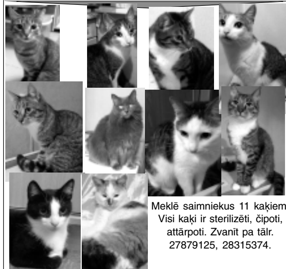
Meklē saimniekus 11 kaķiem. Visi kaķi ir sterilizēti, čipoti, attārpoti. Zvanīt pa tālr. 27879125, 28315374.