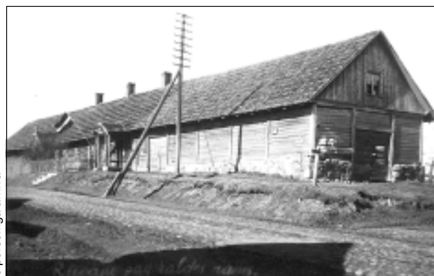
Senais pagasta valdes nams.

Kādreiz bija dzirnavas. Katram laikam sava vēsture. Un ar namiem notiek līdzīgi.