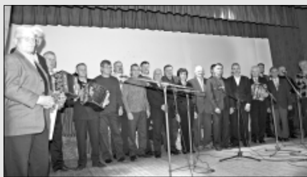
Medņevā tiekas ermonīku meistari.

● Zaļš un kluss guļamvagns Pierīgā Ciemojamies Baldones novadā