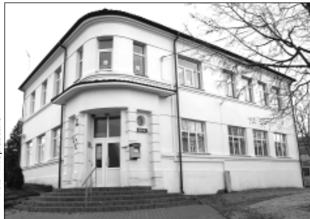
Baltais nams. Tagad šo ēku Rugājos dēvē par Balto māju. Tajā iekārtojušās un ikdienā strādā dažādas iestādes.