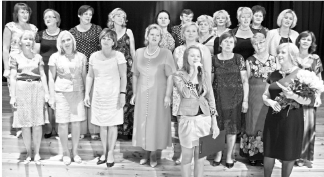
Jubilāri. Pirmsskolas izglītības iestādes “Ieviņa” kolektīvs 25 gadu jubilejas pasākumā saņēma milzum daudz paldies vārdu, kā arī Balvu novada domes un Kubulu pagasta pārvaldes pateicības rakstus.