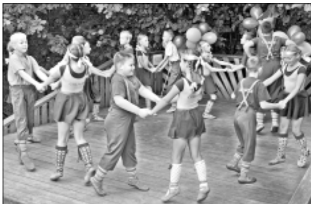
“Cielaviņa”. Neviens koncerts, kā arī svētki nav iedomājami bez “Cielaviņas” dejotājiem. Arī šo sestdien mazie dejotāji apliecināja, ka prot pārsteigt ikvienu.