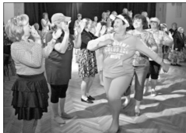
Iejūtas bērnu lomā. Bērnudārza “Ieviņa” kolektīvu sveica arī Eiropas deju kopas “Rūtas” dāmas, kuras veiksmīgi iejutās bērnu lomās.