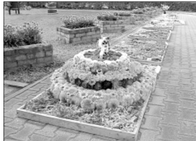
Ziedu paklāji. Pie Kubulu pagasta pārvaldes ikviens interesents varēja aplūkot 15 ziedu kompozīcijas. Par visskaistāko žūrija atzina pagasta pārvaldes darbinieku veidoto ziedu paklāju “Šūpulītis”.