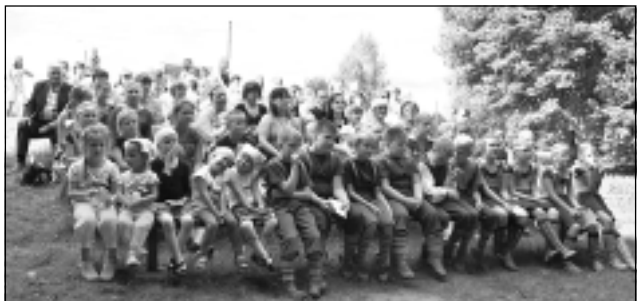
Estrādē pie bērnudārza. Koncertā uzstājās bijušie pirmsskolas izglītības iestādes “Ieviņa” audzēkņi, kuri gan dejoja, gan dziedāja, gan arī iejutās skatītāju lomā.