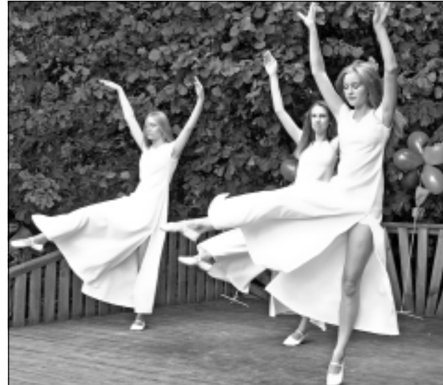
Pārsteidz skatītājus. Jaunietes ar graciozām kustībām apliecināja, ka dejā iespējams viss, tostarp uzburēt dažādas emociju gammās.