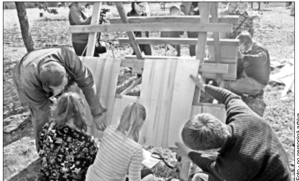
Skaidiņu uzklāšana jumtam. Kad visi nepieciešamie darbi bija paveikti un skaidiņas sagatavotas, meistardarbnīcas dalībnieki tās uzklāja uz iepriekš sagatavotā divslīpju jumtiņa.