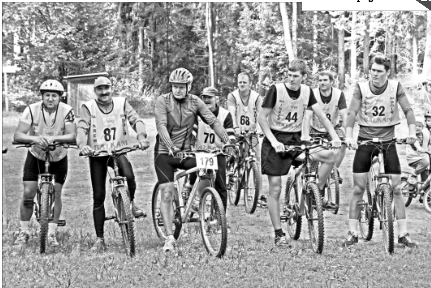
Pirms sacensībām. Viļakas novada čempionātā riteņbraukšanā šo svētdien startēja 20 sportisti.

SIA "ZAAO" sadarbībā ar Latvijas Zaļo punktu aicina skolas un pirmsskolas izglītības iestādes iesaistīties otrreizējai pārstrādei derīgu materiālu nodošanas konkursā "Dabai labu darīt!". Konkurss rīkotāji vēlas, lai bērni aizdomātos, ka viss liekais nav jāizmet, vairākas lietas ir iespējams nodot otrreizējai pārstrādei jaunu lietu radīšanai, tādējādi saudzējot dabas resursus. Pieteikšanās konkursam līdz 1. oktobrim.