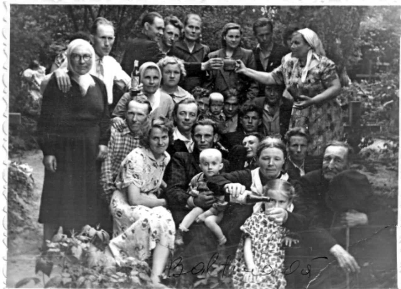
Skumjas un liksmība vienkopus. Attēls, kas uzņemts 1961. gada 28. maijā Baltinavā, Gubas kapsētā, apliecina vārda 'kapusvētki' pretrunīgo nozīmi – skumjas un tuvinieku atcerēšanos pie kapu kopiņām, un vienlaikus arī dzīves svinēšanu.