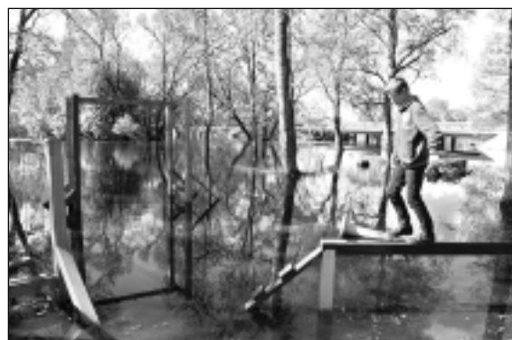
M.Sprudzānes teksts, A.Kirsanova foto