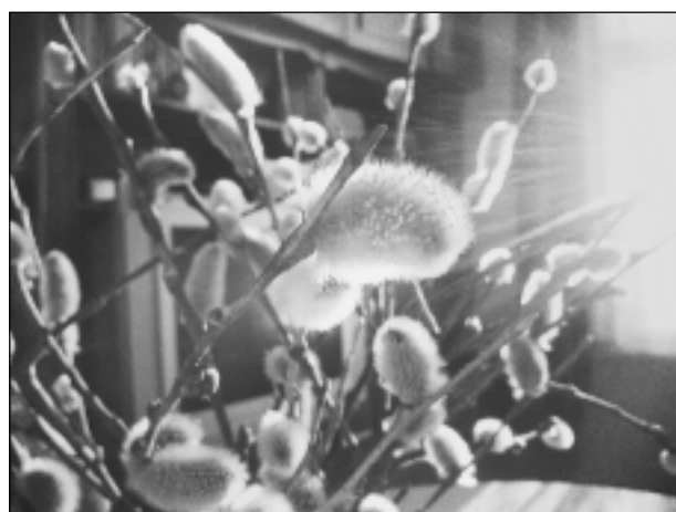
Pūpoli. Iesūtīja Sanita Kupča no Balviem.

Katra mēneša labākās fotogrāfijas autors saņems balvu. Fotogrāfijas var iesūtīt pa pastu – Balvi, Teātra ielā 8, LV-4501, vai elektroniski – vaduguns@apollo.lv. Pie foto obligāti norādāms vārds, uzvārds (vēlams - tālrunis).