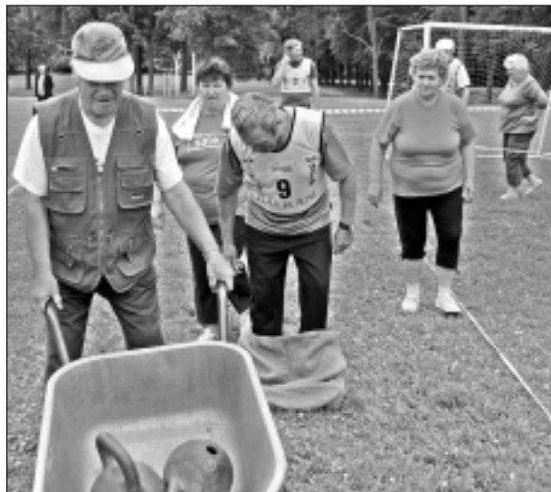
Smagā ķerra. Komandu stafetē bija dažādi uzdevumi un viens no tiem - smagākais - bija ķerras ar divām svarbumbām stumšana.