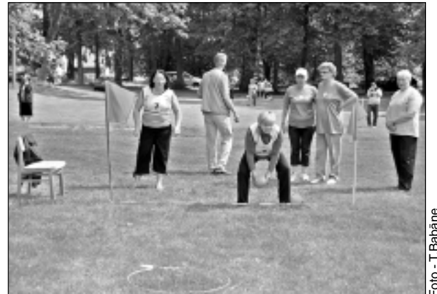
Kā trāpīt mērķi? Bumbu dalībniekiem vajadzēja trāpīt tuvāk un tālāk izliktos riņķos, kas nemaz nebija tik viegli. Jo precīzāks un tālāks bija trāpījums, jo vairāk punktu varēja iegūt.