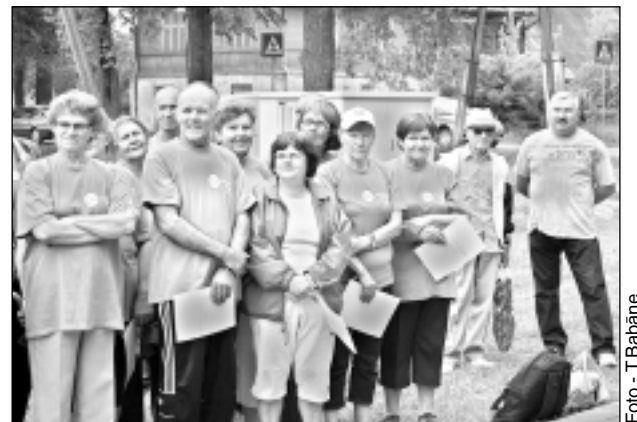
Kupravas pagasta komanda. Viņi var lepoties un saukt sevi par sportiskiem ļaudīm - kopvērtējumā iegūta 2.vieta.