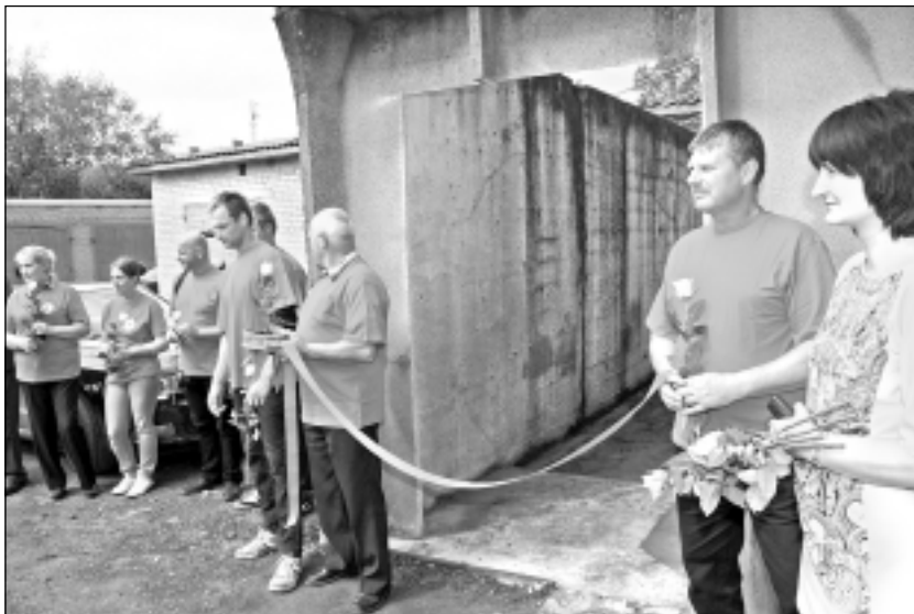
Glābējkomanda. Sakarā ar novada domes izsludinātā iepirkuma rezultātiem, atskurbtuves pakalpojumu nodrošinās biedrības "Latvijas Sarkanais Krusts" darbinieki - 5 uzraugi, 2 apkopējas un vadītājs, ko algos pašvaldība.