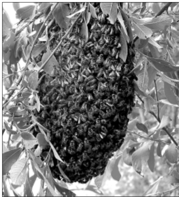
Bišu spiets ceļmalā. Iesūtīja Daidze Andersone no Balvu pagasta.

Katra mēneša labākās fotogrāfijas autors saņems balvu. Fotogrāfijas var iesūtīt pa pastu – Balvi, Teātra ielā 8, LV-4501, vai elektroniski – vaduguns@apollo.lv. Pie foto obligāti norādāms vārds, uzvārds (vēlams - tālrunis).