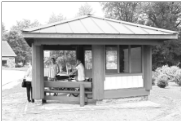
Informācijas namiņš. Jaunais informācijas namiņš ir vizuāli pievilcīgs. Namiņā jau laiku kavēja divi vietējie iedzīvotāji, kuri stāstīja, ka tā būs jaunā auto pietura un tādu pašu arī gribētu otrā laukuma malā, tā sakot - no kuras puses autobuss kursē, pie tās pieturas arī pietāj.

Baltinavas novada deputāti un pašvaldība ne reizi vien pārrunājuši jautājumu par autobusu pieturvietas apkārtnes labiekārtošanu, kas ir viena no ciemata centrālajām vietām. Realizējot projektu, netālu no autobusu pieturas ir uzstādīts novada informatīvais namiņš, kur ceļotāji, arī novada iedzīvotāji, varēs smelties informāciju par ievērojamākajām novada vietām. Plānots, ka namiņā atradīsies gan novada karte, gan apskatāmo objektu attēli, bet auto pietura gan nav plānota.