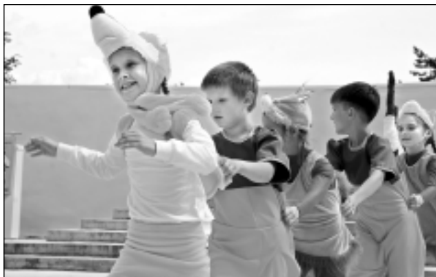
Mazākie dejotāji. Pleskavas apgabala deju ansambļa "Ruskiye uzori" mazākie dejotāji Viļakā apliecināja, ka svarīgākā pasaulē ir draudzība.