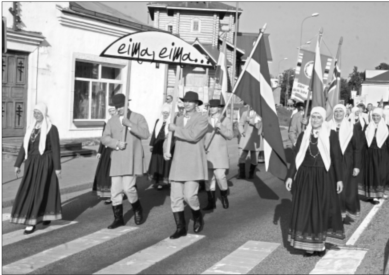
Gājiens. Šī šogad jau bija trešā, tā teikt, parāde Balvu centrālajā ielā. 31.maijā balveniešus un pilsētas viesus priecēja 19. bērnu tautu deju festivāla "Latvju bērni danci veda" dalībnieki, bet 8.jūnijā mūs pārsteidza garas motociklistu kolonnas.