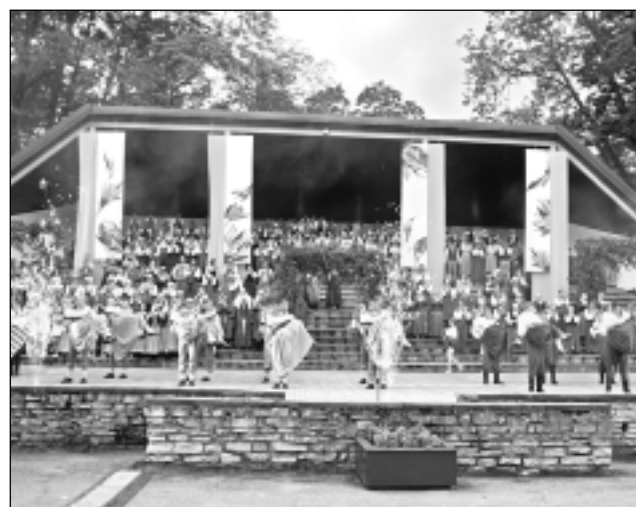
Epilogs. Lielkoncerts Balvos noslēdzās ar salūtu un jestrū garstāvokli.