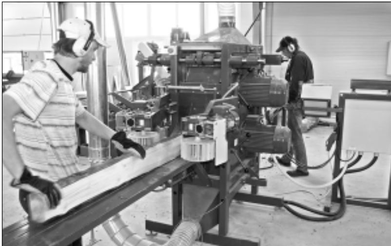
Ražošanas process. Renovētajā kokzāģētavā ražošanas process norit raiti un strādniekiem ērtos apstākļos.

Renovējot kokzāģētavu, darīts iespējams, lai darba procesā strādniekiem būtu ērti darboties pie darba galdiem, brīvi un droši pārvietoties visā kokzāģētavas ēkā. “Maksimāli esam piedomājuši par ergonomiskajiem risinājumiem darba vidē, jo tie būtiski uzlabo darba vides kvalitāti, paugstina nodarbināto darbības, nodrošina ražošanas tehnoloģiju drošību, dodot nozīmīgu ieguldījumu saimniecības ilgtspējīgā un konkurētspējīgā attīstībā. Tas arī bija viens no svarīgākajiem uzstādījumiem, veicot ražošanas ēkas renovāciju - lai tā nelīdzinātos gaterim, kādi kādreiz darbojās katrā ciemā un kas iedzīvotāju acīs bija “pēdējā” darba vieta, kur cilvēks strādāja caurvējā, pufaiķā un noplīsušiem darba cimdkiem. Zāģētavas darba vidi esam sakārtojuši, lai strādnieku un iedzīvotāju acīs turpmāk tā būtu prestiža darba vieta, kur gribas un ir patīkami strādāt,” norāda zāģētavas īpašnieks. Ražošanas ēkā tagad ir izbūvēta atpūtas un pusdienu