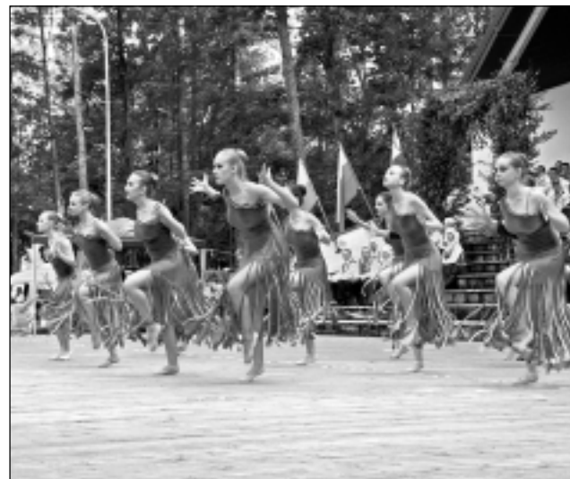
Šķiet, vīri bija sajūsmā! Skatītājus sajūsmināja deju kolektīva "Rapsodija" no Polijas priekšnesumi, kur jaunietes iejutās dažādos tēlos, nomainot vienu skatuves tērpu pēc otra. Jāpiebilst, ka viscītīgāk poliešu dejas fotografēja stiprā dzimuma pārstāvji...