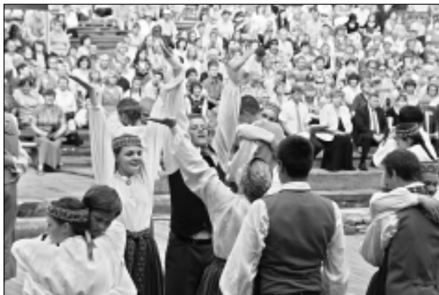
Abpusējs prieks. Jauks garstāvoklis sestdien Balvos bija gan skatītājiem, gan dejotājiem. Kā nu ne, ja ārā bija jauks laiks.