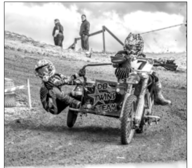
"Baltajā briedī". Iesūtīja Juris Kašs no Balviem.