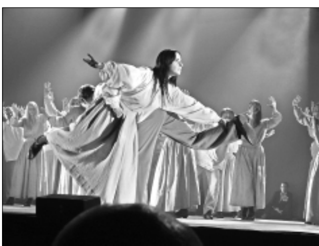
Noslēguma koncerts. Svētku izskaņā atklāja, kur amatierteātru salidojumu rīkos nākamreiz. Tas būs kaimiņos – Gulbenes novadā. Mūspuses cilvēki būs īpaši izdevīgā situācijā, jo varēs braukt un skatīties daudz un dažādas teātra izrādes, salīdzināt amatierteātru kolektīvus un priecāties par tiem.

Brivbrīdi sagatavoja M.Sprudzāne, autore foto