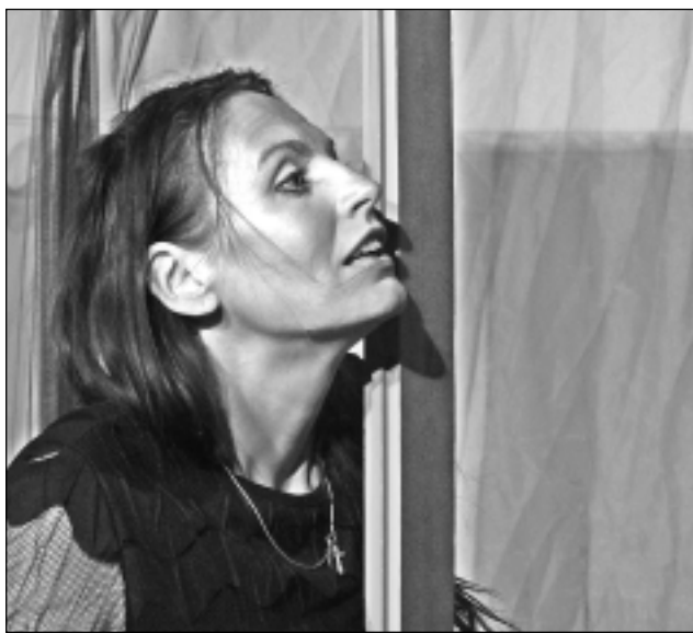
Uz skatuves dēļiem. Talantīgs aktieris pavisam viegli pārved skatītāju pāri tai trauslajai robežai, aiz kuras beidzas teātris un sākas patiess pārdzīvojums.