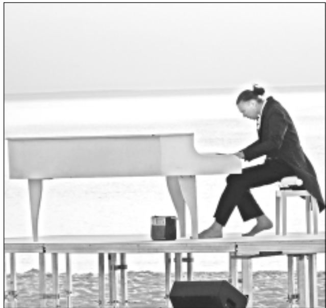
Uz skatuves brīvā dabā. Teātru festivālu atklāja ar šīku Ventspils pludmalē.