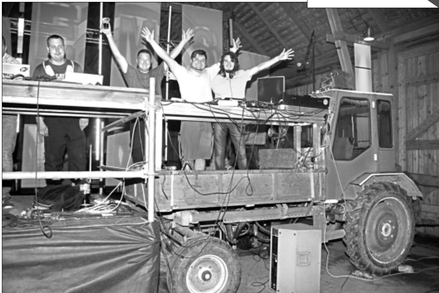
Šķūnis. Elektroniskās mūzikas skatuve jeb tautā sauktais šķūnis šogad bija īpašs, jo didžeji bija sarūpējuši pat traktoru, lai fanus pārsteigtu ar savdabīgu odziņu .

● Startēs ducis Tuvojas 12.Saeimas vēlēšanas