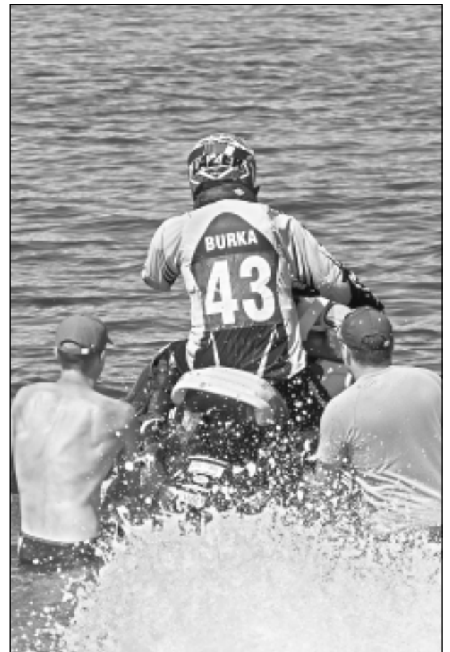
Sacensības ezerā.