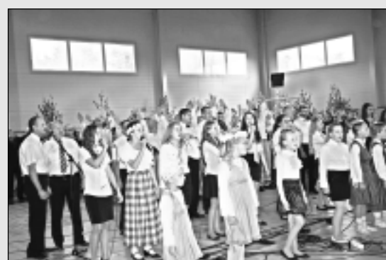
Rugāju skola svin 110 gadu jubileju.