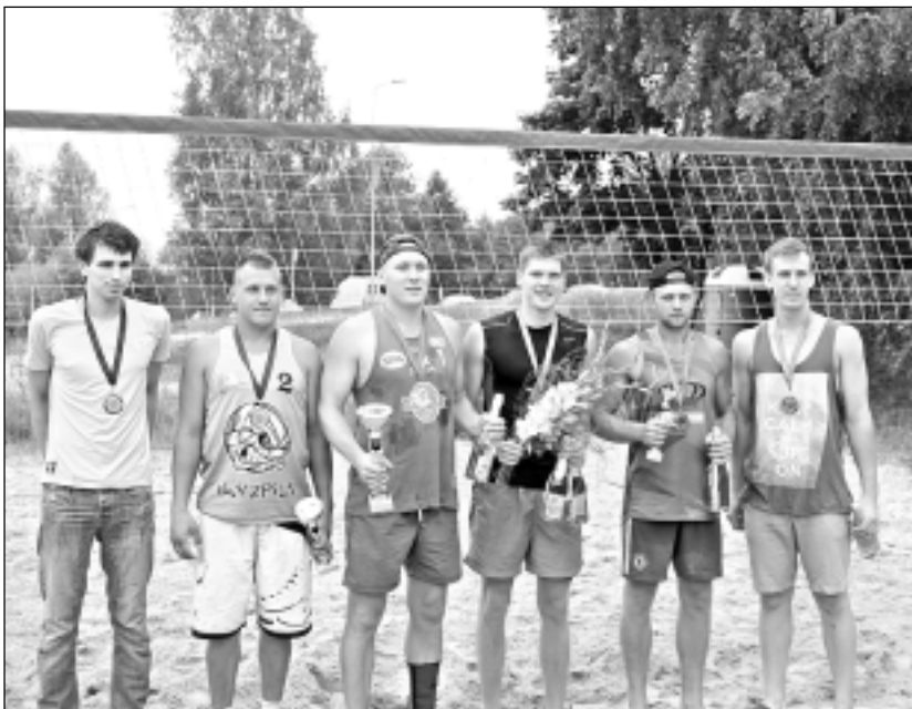
Pirmais trijnieks jauniešiem. Šajā grupā cīņas bija vissprāigākās un par uzvaru nācās cīnīties visilgāk.