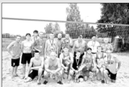
Noslēdzies pludmales volejbola turnīrs.