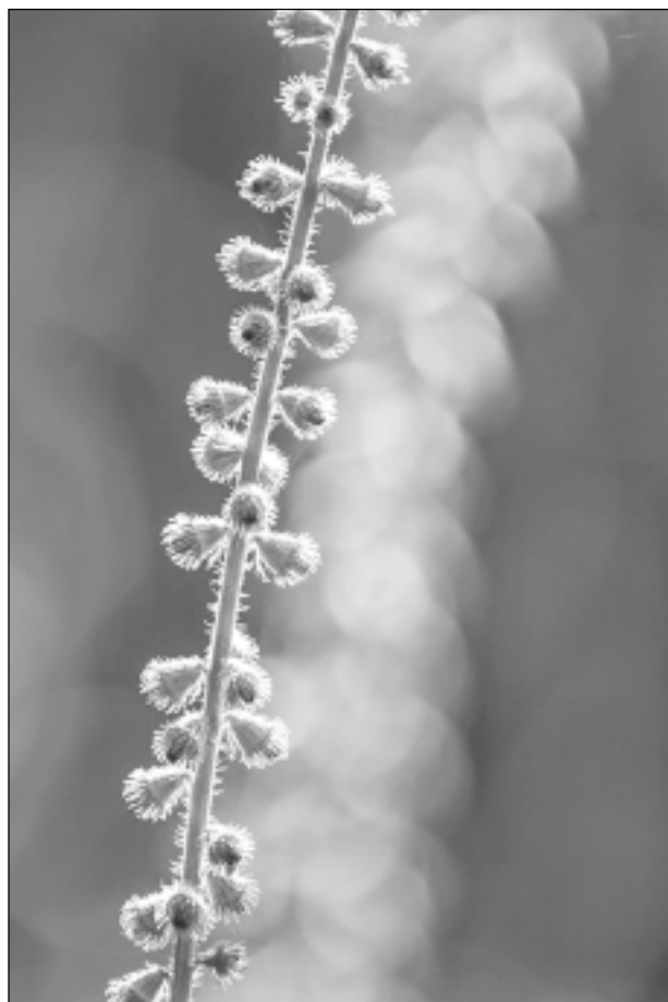
Priecē daba. Iesūtīja Kintija Andersone.

Katra mēneša labākās fotogrāfijas autors saņems balvu. Fotogrāfijas var iesūtīt pa pastu – Balvi, Teātra ielā 8, LV-4501, vai elektroniski – vaduguns@apollo.lv. Pie foto obligāti norādāms vārds, uzvārds (vēlams - tālrunis).