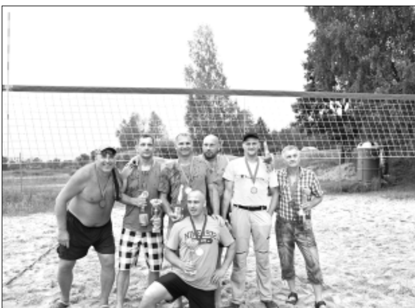
Medaļas sadala veterāni. Grupā 40+ cīnījās vīri, kuriem pieredze volejbola spēlē ir vislielākā.