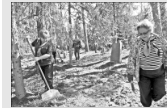
Sakopj ebreju senkapus.