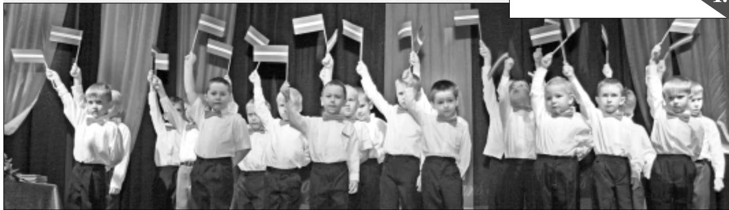
Pirms četriem gadiem. Bērnudārza “Sienāzītis” zēni, stāvot uz Balvu Kultūras un atpūtas centra skatuves, sūta sveicienus Latvijai!