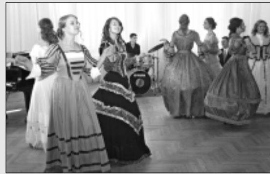
Balvu Mūzikas skola aizvada svētku dienu.