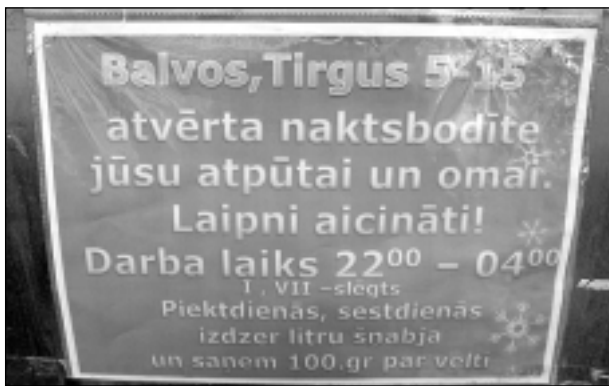
Vilinošs piedāvājums. Naktsbodītes atvēršanas sākumā uz durvīm pie ieejas apmeklētāji varēja iepazīties ne tikai ar kafejnīcas darba laiku, bet arī ar vilinošu piedāvājumu: izdzer litru šņabja un saņem 100 gramus par velti! Droši vien narkologiem par šo piedāvājumu būtu ko teikt.