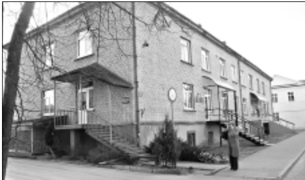
Māja Tīrgus ielā 5. Mājas iedzīvotāji bezpalīdzībā plāta rokas: problēmu šeit vairāk nekā vajag, bet risinājuma nav.

Taču minētā bāra darbība Tīrgus ielā 5 nav vienīgā problēma, ar kuru nākas saskarties mājas iedzīvotājiem. Divpadsmit dzīvokļu mājā ir seši īpašnieki, kuri veic komercdarbību, un katrs no viņiem diktē savus noteikumus mājas iedzīvotājiem. “Mums nebūtu nekas pretī viņu darbībai, ja vien viņi rēķinātos ar iedzīvotāju interesēm un arī augstākstāvošās organizācijas ieklausītos mājas iedzīvotāju problēmās, nevis tikai lobētu komercdarbību. Mēs nekad nebijām jutušies tik neaizsargāti, tik bezspēcīgi un