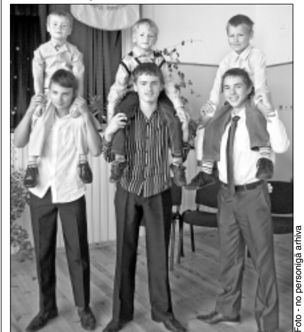
Briežuciema pamatskolas 9.klases skolēni 2.septembrī svinīgi ienesa zālē nākamos pirmklasniekus. Jautru noskaņu svētkos radīja Karlsona un Pepijas Garzeķes ierašanās, kuri pārbaudīja skolēnu prasmi skaitīt un atrast paslēptās mantas, kā arī pasniedza dāvanas pirmklasniekiem un pirmsskolas grupiņas bērniem.