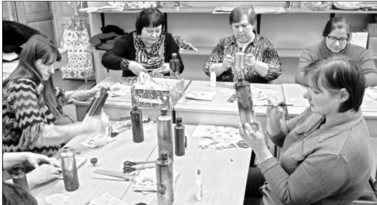
Apglezno pudeles. Nodarbībās vizuāli plastiskās mākslas darbnīcā baltinavietes mācījās apgleznot pudeles ar stikla krāsām, kā arī darboties dekupāžas tehnikā.