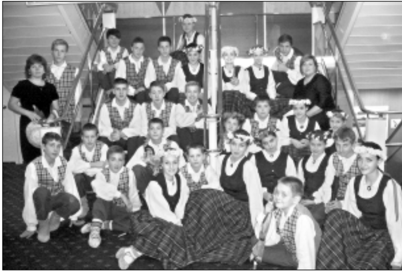
Tautasdeju kolektīva "Cielaviņa" dejojāji uz kruīza kuģa. Tobrīd viņi vēl pat nenojauta, ka mājupceļš no Stokholmas izrādīsies pārdzīvojumu pilns.

"Cielaviņas" dalībnieki stāsta, ka vētra ar liegu iešūpošanos, kas pamazām pārauga spēcīgās vēja brāzmās, sākusies ap pulksten 22 vakarā. "Mūsu vidū nemiers sākās pēc bērnu vecāku atsūtītajām izziņām par gaidāmo spēcīgo vēju, sešus metrus augstajiem viļņiem un pieejamās informācijas masu medijos. Tobrīd vēl bijām Stokholmas ostā. Lai situācija kaut nedaudz kļūtu skaidrāka, aizgājām uz informācijas centru un pajautājām, vai braucieni nav plānots atcelt. Atbilde skanēja, ka viss ir kārtībā un kuģis no ostas aties pēc grafika," stāsta "Cielaviņas"