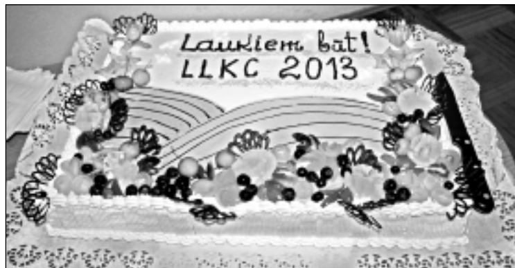
Saldam priekam. Konkursa finālā jaunieši un ciemiņi nobaudīja gardu torti.

Latvijas veiksmīgos un pašus veiksmīgākos jaunos uzņēmējus, kuri gatavi iedzīvināt savas idejas reālā dzīvē. Starp viņiem daudzi jau to dara. Projektu prezentācija atklāja patiešām interesantas jauniešu nodarbes. Viņi ne tikai audzē garšīgās vitamīnogas - krūmmellenes un zemenes, bet redz iespēju pārdot tirgū kā precī ar aromatizētas eļļas, dabiskus etiķus. Cits savu biznesu redz dārzenū un stādu audzēšanā. Vēl kāds aizraujas ar loku un loku šaušanas piederumu izgatavošanu. Vairāki puīši pārliecinoši prezentēja galdniecības izstrādājumu ražošanu ar lāzeru un dažādu koka suvenīru ražošanu. Interesants izklausījās kādas jaunās mākslinieces dizaina pakalpojumu piedāvājums. Finālā žūrija viennozīmīgi apliecināja, ka