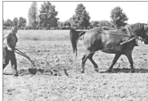
Kā senos laikos. Iesūtīja Daniels Kivkucāns no Balviem.