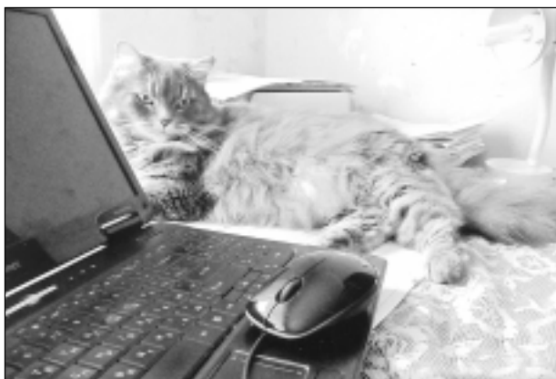
Pele ar plastmasas piegaršu.

Katra mēneša labākās fotogrāfijas autors saņems balvu. Fotogrāfijas var iesūtīt pa pastu – Balvi, Teātra ielā 8, LV-4501, vai elektroniski – vaduguns@apollo.lv . Pie foto obligāti norādāms vārds, uzvārds (vēlams - tālrunis).