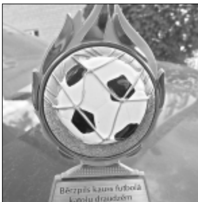
Skaisti piemiņas kausi. Tos Bērzpils organizatori bija meklējuši un pasūtījuši Daugavpilī.

Ļoti spraiga cīņa noritēja tieši par 1. un 2. vietu. Puīši centās vaiga sviedros, bet šoreiz veiksmē bija Ciblas komandas pusē, jo tieši pēdējās sekundēs Ciblas komanda pievarēja Daugavpils komandu ar 3:1. Pēdējās minūtes rezultāts bija 1:1, pēdējās 3 minūtes - 2:1, bet pēdējās sekundēs Ciblas komandai izdevās pārspēt Daugavpils komandu un iegūt trīs vārtus. Cīņā par 2. un 3. vietu tikās Bērzpils un Baltinava, un arī šī spēle bija interesanta. Līdzjutējiem bija prieks, ka savējie - Bērzpils futbolisti - uzvarēja Baltinavas komandu ar rezultātu 3:0. Par labāko spēlētāju atzina Ludzas prāvestu Jāni Kolnu.