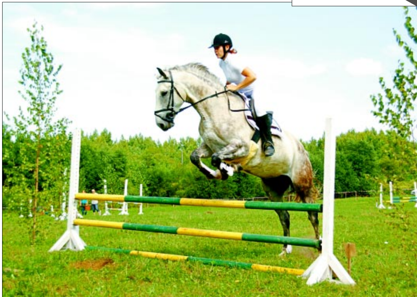
Elpu aizraujoši lēcieni. Skatītāju vētrainus aplausus izpelnījās sportisti, kuri startēja gan 60, gan 80, gan 100 centimetru augstās šķēršļu pārvarēšanas sacensībās.

No 19. līdz 24.augustam Latvijas Radio 1 plaši atspoguļos Sibīrijā notiekošo starptautisko latgaliēšu konferenci. Par tur pieredzēto dažādos raidījumos stāstīs LR1 žurnāliste Anda Buševica.