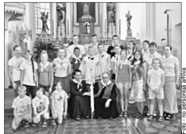
Draudzes dievnamā. Svētceļojuma dalībnieki pirms tāla un svētīgā ceļa kopīgi nufotografējās Baltinavas baznīcā.