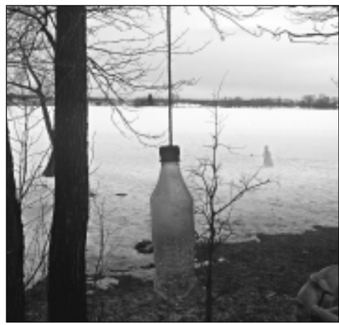
Cilvēku roku darbs. D.Sirmā attēlā redzamo, uz koka zariem Vecajā parkā pakārtu pudeli, dēvē par neveiksmīgām cilvēku spēlītēm. Tā droši vien arī ir, jo maz ticams, ka pudeli zarā pamanījās uzkarināt kāds no meža dzīvniekiem. Jāpiebilst, ka balveniete iemūžināja arī zarā pakarinātu divlitrīgu alus pudeli.