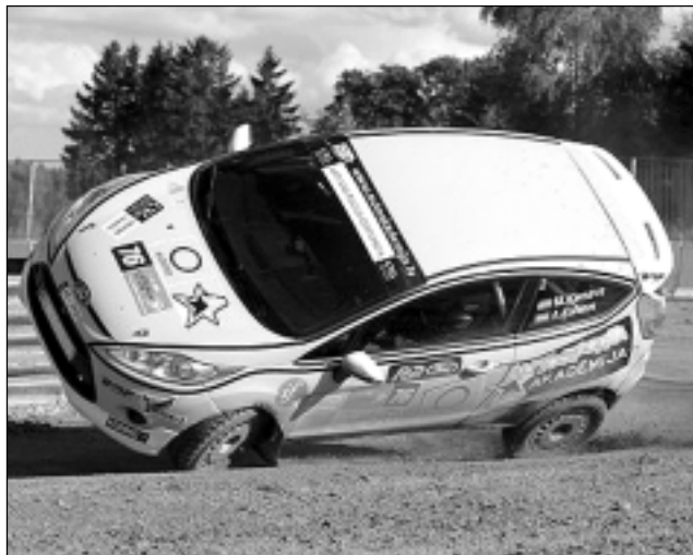
Pierāda sevi "OKartes Autosporta Akadēmijā". Otrās atlases kārtas braukšanas pārbaude bija ļoti nopietna, sportistu sniegumu trasē un ārpus tās vērtēja profesionāla žūrija.