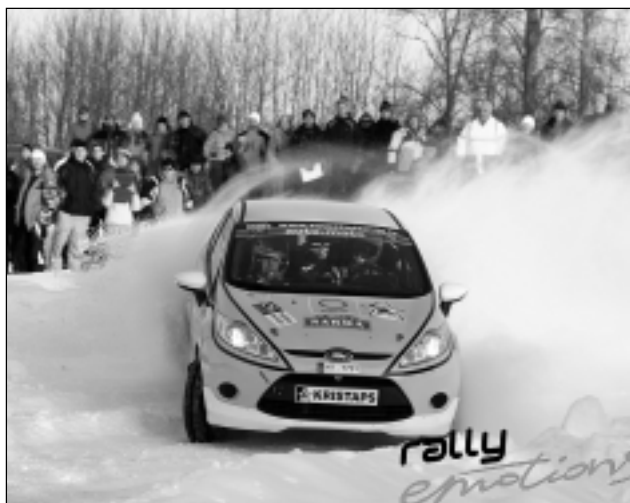
Sniegotajā trasē. Latvijas Rallija čempionāta 3.posmā "Sarma" Kristapa pilotēto zaļo Fordiņu skatītāji pavadīja ar skaļām ovācijām.

Brīvbrīdi sagatavoja Z.Logina