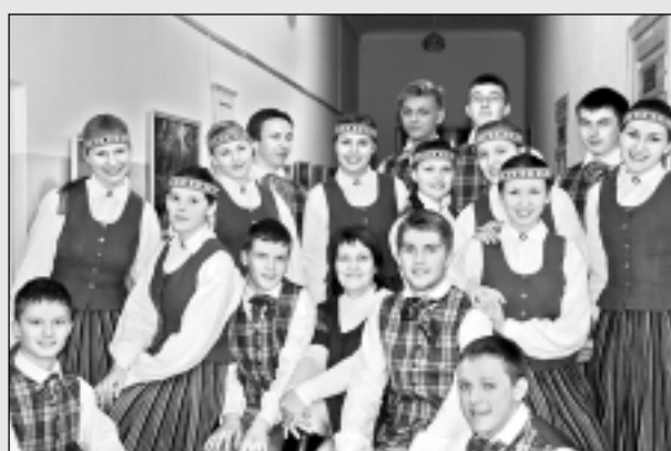
Aizvada deju kolektīvu skati.