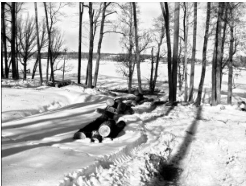
Tā izskatās šobrīd. Retinot Balvu parkā pāraugušos kokus, veidojas pievilcīga ainava un skats uz ezeru.