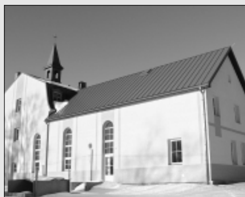
Viļakā atjauno klostera ēku.