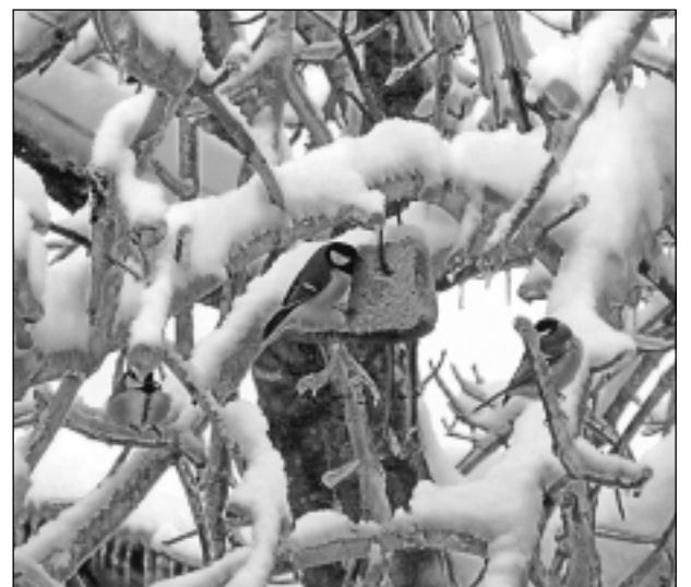
Kārumnieces. Iesūtīja Anīta Antuha no Bērzpils pagasta.