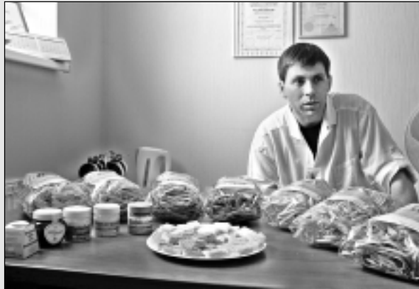
Raunas novada bagātības – cilvēki un daba.