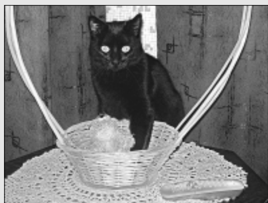
Melnais Ločmeļu ģimenes mīlulis.