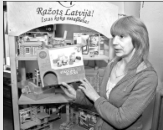
Ar Burtnieku novada uzņēmuma "Varis Toys" ražotajām koka rotaļlietām spēlējas bērni visā Eiropā.