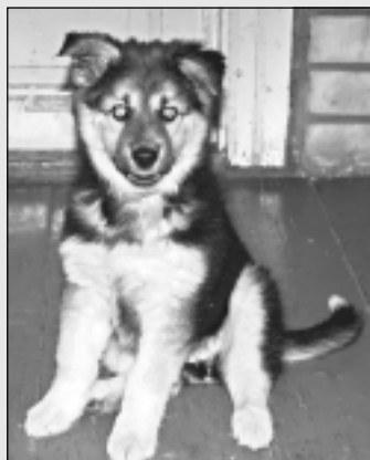
Aug mājas sargs.