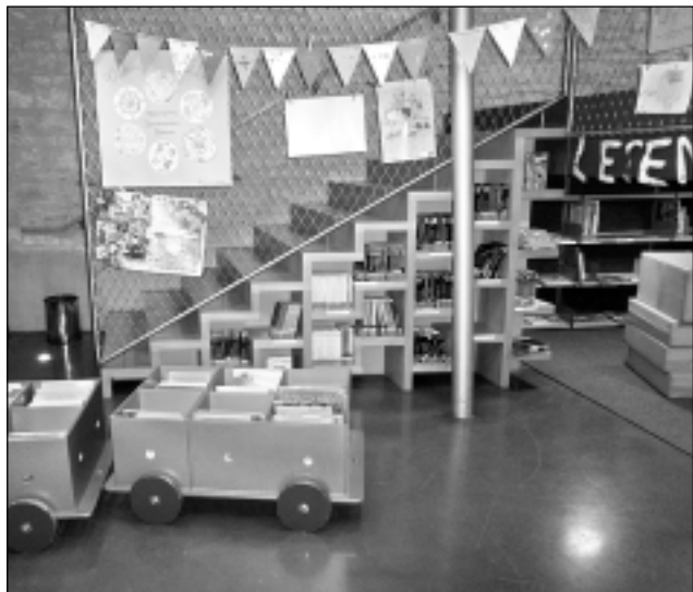
Bērnu stūrītis. Grāmatas tajā saliktas gan vilciena vagonos, gan mazos plauktiņos zem trepēm. Izlikti bērnu zīmējumi un ērtākam darbam izgatavoti speciāli mīksti sēdekliši.