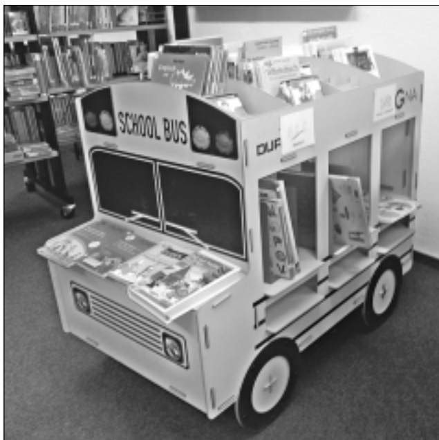
Daudz domā par bērniem un skolēniem. Grāmatas bibliotekāri cenšas salikt savdabīgos un interesantos plauktos, arī šādā skolas busiņā .