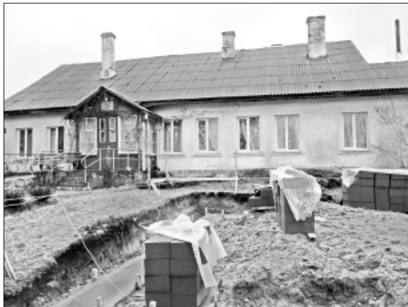
Top jauna ēka. Tuvākajā nākotnē - 2013. gada nogalē - Rugāju sociālās aprūpes centrs izskatīsies citādāks. Top jauna ēka ar 11 istabām un zāli. Uzlabosies nama iemītnieku sadzīve, jo nākotnē vienā istabiņā nevajadzēs kopā dzīvot pieciem cilvēkiem, kā tas ir patlaban. Ideju par nama pārveidi īsteno Rugāju novada pašvaldība.

fiziskajai varēšanai, daudzi kļūst vientuļnieki, turklāt ir arī slimi, - kur palikt šādiem cilvēkiem? Aprūpes centrā mīt gan vietējā, gan arī citu novadu ļaudis, kuri dzīvo pēc noslēgto līgumu nosacījumiem. Maksājumus vadītāja vērtē kā ļoti demokrātiskus, iespējams, pat vienus no zemākajiem valstī. Iemītnieki, kuriem pensija pārsniedz 200 latus, par dzīvošanu centrā maksā 5 latus dienā, mēnesī maksimāli samaksājot 155 latus, pārējiem šie izdevumi ir 90% no pensijas. Medikamentus, pamperus vai ko citu, kas nepieciešams pašu vajadzībai, iemītnieki pērk par saviem līdzekļiem. Taču pastāv iespēja, protams, izmantot arī humāno sūtījumu līdzekļus, ja tādi ir.