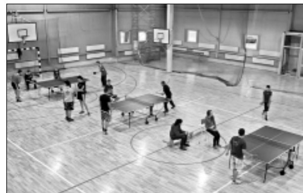
Galda tenisa sacensībās. Viļakas Valsts ģimnāzijas sporta hallē novada atklātās galda tenisa sacensības notika uz trīs spēļu galdiem.

Pret Liepājas novada Sporta skolu volejbolisti spēlēja cerīgāk, bet seta galotnes atkal neizdevās noslēgt sev par labu, kā rezultātā zaudējums 0:2. Trešajā spēlē pret Jēkabpils Sporta skolu līdz seta vidum ritēja līdzīga spēle, bet seta izskaņā pietrūka spēka, spēlētāji pieļāva vairākas kļūdas. Rezultātā zaudējums ar 0:2. Otrajā dienā spēles bija pret abām Rīgas komandām. Pirmajā spēlē pret Rīgas Volejbola skolas pirmo komandu ritēja līdzīga spēle - pirmo setu uzvarēja rīdzinieki, bet otrajā setā pārāki bija Viļakas novada BJSS volejbolisti. Izšķirošajā setā (līdz 15 punktiem) pārāki bija rīdzinieki, un kopumā zaudējums ar 1:2. Līdzīgs scenārijs bija arī pret Rīgas Volejbola skolas otro komandu. C2 grupas zēniem Viļakas Sporta skolas komanda ierindojās 6. vietā. C1 grupas zēniem 10.-13. vietu noskaidrošana notika Viļakas Valsts ģimnāzijas sporta hallē 4. novembrī. Savā starpā tikās Rūjienas novada Sporta skola, Viļakas novada BJSS un Viesītes Sporta skola. Viena komanda uz finālu neieradās. Rūjienas novada Sporta skola uzvarēja abās spēlēs ar 3:1, pārspējot Viļakas novada spēlētājus un ar 3:0 Viesītes Sporta skolu. Savukārt Viļakas novada BJSS pārspēja Viesītes Sporta skolu ar 3:0. Kopvērtējumā C1 grupas zēni ierindojās 11. vietā.