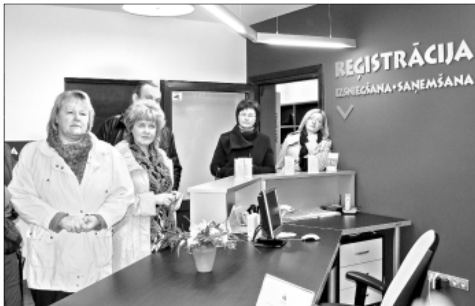
Gaismas pils Līvānos. Pieredzes apmaiņas brauciena dalībnieki vēl ilgi atcerēsies krāsaino, rekonstruēto Līvānu bibliotēku ar iekārtojumu, izvietojumu, plašajām telpām un pakalpojumiem, ko sniedz saviem lasītājiem.