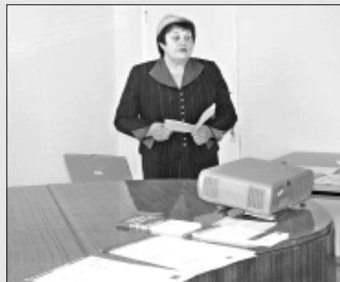
Seminārā uzņēmēji uzzina jaunāko informāciju.