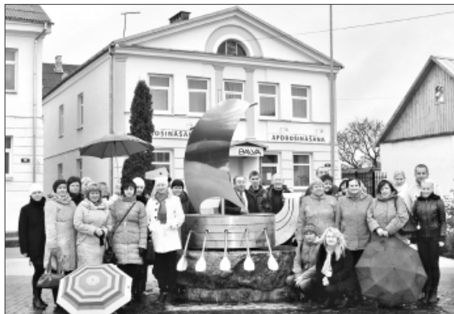
Krāslavas vecpilsētā. Tajā ir rekonstruēts skvērs, gājēju ceļiņi un izveidots novada simbols - laiva ar pieciem ariem, kas simbolizē novadā dzīvojošās tautības: latviešus, krievus, baltkrievus, poļus un ebrejus.