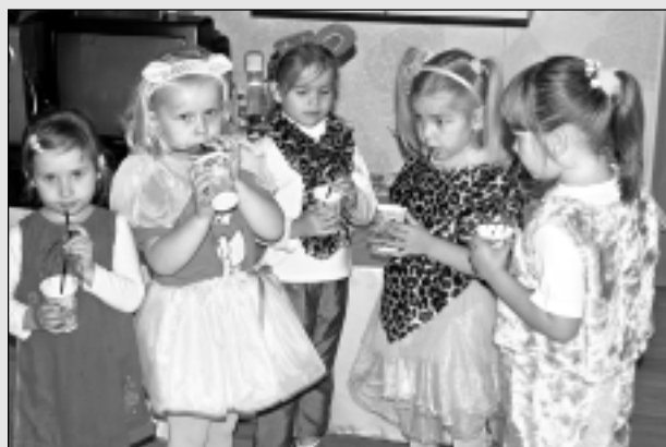
Dzimšanas dienas ballīte bērnam.