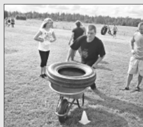
Sportiskas izklaides Saipetniekos.