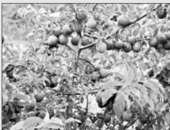
Pieredzes brauciena atziņas.