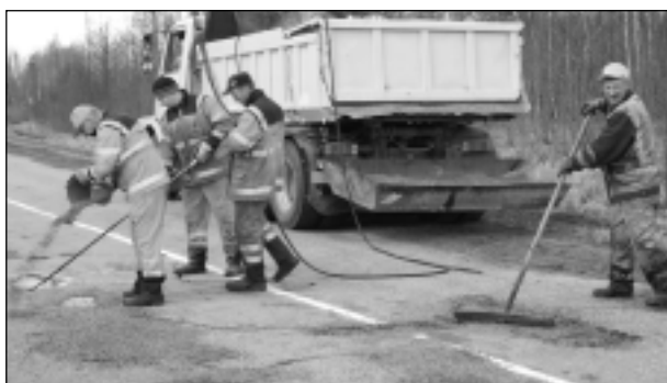
Bedrīšu remonts. Šonedēļ sākās bedrīšu remonts ceļa posmā Dubļeva - Cērpene.

Televīzijā bijām liecinieki akcijai, kurā tās dalībnieki bedrēs uz ceļiem stādīja puķes, lai pievērstu uzmanību mūsu ceļu